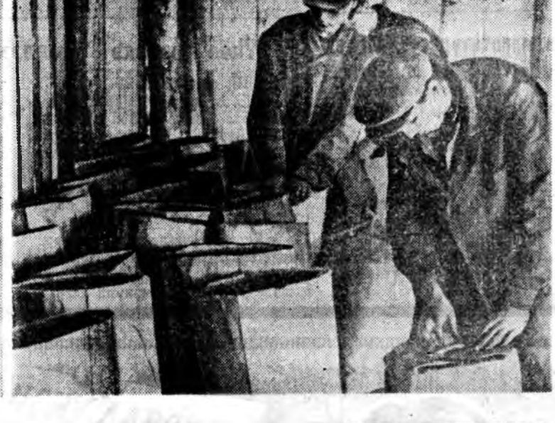
Ургалмай ногоо мийл юрэ сабшаад, хатажа үбөн болгоод хурилханда орхолодо, таранине ногоохон задан тусхай машина...