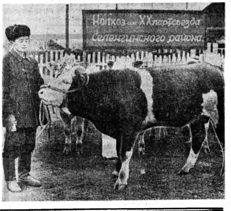
Ургалмай ногоо мийл юрэ сабшаад, хатажа үбөн болгоод хурилханда орхолодо, таранине ногоохон задан тусхай машина...