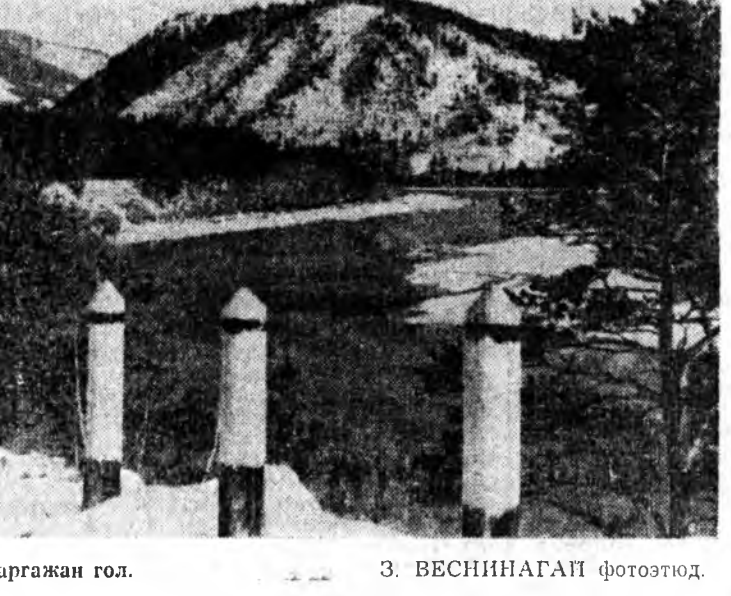
Баргажан гол.

АДРЕС ОБЪЕДИНЕННОЙ РЕДАКЦИИ: гор. Улан-Удэ, ул. Ленина, 35. Телефоны: редактора — 23-67, зам. редактора — 38-42, зам. редактора — 35-84, секретариата — 27-37, отделов: сельскохозяйственный — 47-59, 35-14, промышленный — 48-89, 33-61. УЛАН-УДЭ, 26. Телефонны отделов: партийной жизни — 40-49, идеологический — 24-74, 60-21, советского строительства и быта — 34-93, рабселькорства и писем — 25-41, 38-30, информации — 34-05 и перевод — 24-74. гор. Улан-Удэ, типография управления по печати при Совете Министров Бурятской АССР. H02025. Зак. № 1131.