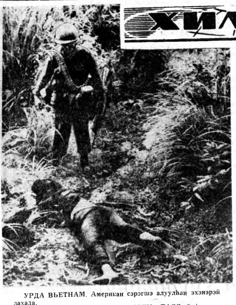
УРДА ВЬЕТНАМ, Американ сэрэгшэ алуулһан эхэнэрэй заханда.