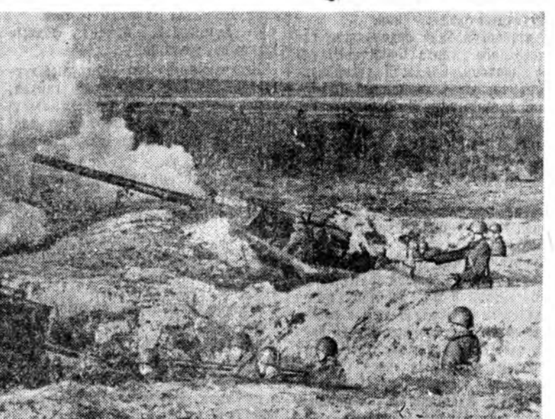
Артиллерийн батарей тактическэ хуралсалай үедэ.