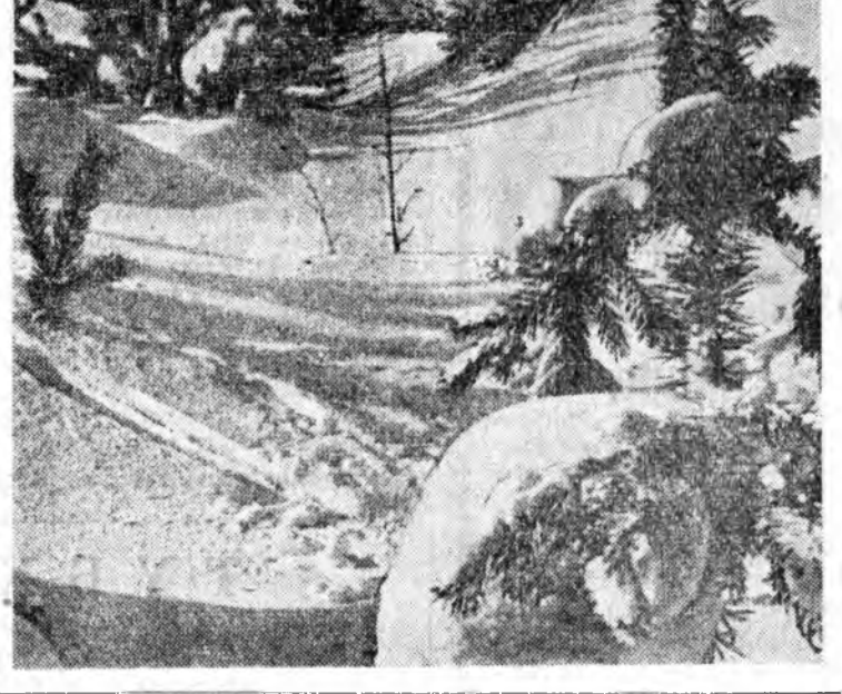
Тухайда хүдэлмэришд забастовкодо мэдхитэйгээр хабаадаһанайнгаа улшо Японий гүрэнэй мэдэлэй түмэр замай 500 гаран хүдэлмэришд ба алба хаагшад элдэб илшээр хэлэгдэе.