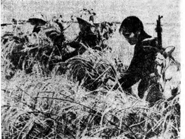
ВЬЕТНАМАЙ ДЕМОКРАТИЧЕСКА РЕСПУБЛИКА. Куанбин провинциин Дай Фонг гэжэ хүдөө ажарын кооператива барайгар ВИА—ТАСС-ай фото.

хүсэнүүд табалдуулаа. ВИА агентствын дамжууланай фотор, эхдэ болон байлдаануудай үедэ дайсанай 500 гаран солдат ба офицернууд үгы хэдгээн мүн 2 самолет үнагагдана байна.