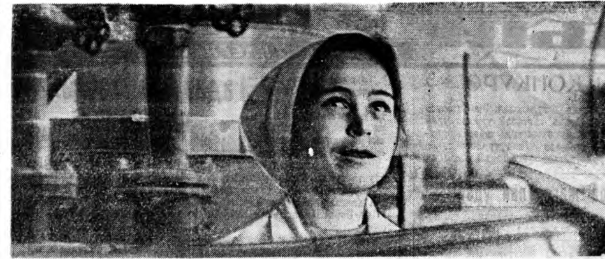
Энэ жэлэй жэмэс болон овоной ургас ялала баян. Тиммэнэ жэмэс болон овоной заводоуд ажал эхэтэй байба. Түхэнэй жэмэс болон овоной заводо худалмэри түрэг дундаа ялана.

Геологууд Сибирини нефтьие олон жэлдэ элирүүлжэ ялахан юм. Сибирьтэ нефть, газ байхал ёһотой гэжэ академик Иван Губкин урилшалан хэлэбэн байгаа. Нефтин тоналгн хэбэр тэмдгүүд үнэний олодонгые, дарашануудын олодонгогүй нэн. Эсэгэ ороноо хамгаалгын дайны хүлээлээр 10 жэл соо нефть бэрэлтэ ямаршые үрэг чоггүй. Харин 1960 оной ауч Шаим шагар 6-дахи скважинада турүүлшын нефть шатэлһэн юм. Тэрэ гэдэнгээ хошмо 6 жэлэй үнгэрхэдэ, нефть, газар баян газар нэгэ миллион дүрбэлжэн километр-