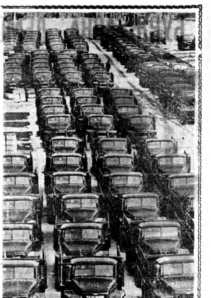
Челябинск область. "Миасс хотын автомобиль заводойн заводойн главна конвейер дээрэнэ ехэ ашаанай машинауд һубарин буужал байна.