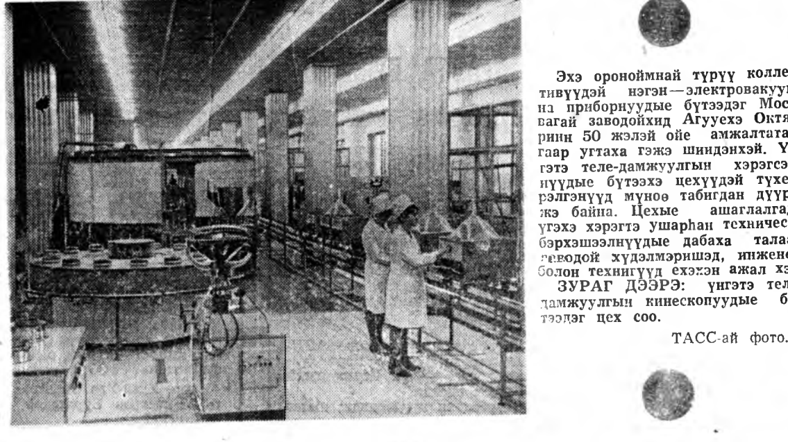
Эхэ оройнойнй түрүү коллективүүдэй нэгэн—электроравкум- ны приборнууде бүтээдэг Москвагай заводоидки Агууэхэ Октябрийн 50 жэлэй ойи амжалтагайгаар угтаа гэжэ шийндэлхэй. Ун- гэтэ теле-дамжуулгын хэрэгсэл- нууде бүтээхэ цехүүдэй түхээр- рэлэнүүд мүнөө табигдан дүүр- гэжэ байна. Цехые ашаалагдаа үгэхэ хэрэгтэ ушаран техническа бархшашнууде дабах талар заводоид хүдэлмэриншэд, инженер болон техникүүд эхэжэн ажал хээ.