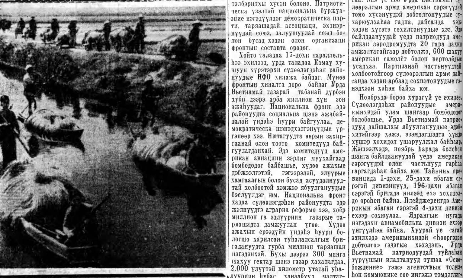
Эрхэ жэлэй шөлара Хардэри...