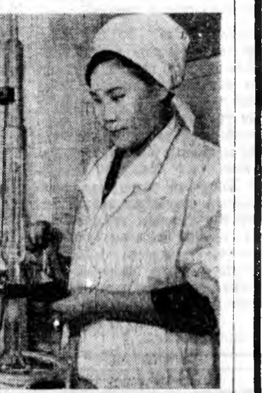
Унда гаргадаг Улаан-Удэн заводой витаминна хөхэйхид шасарганын тоһоний технологи үйлэвэридоө нэгэртүүл-лөн байна.

Унда гаргадаг Улаан-Удэн заводой витаминна хөхэйхид шасарганын тоһоний технологи үйлэвэридоө нэгэртүүл-лөн байна.