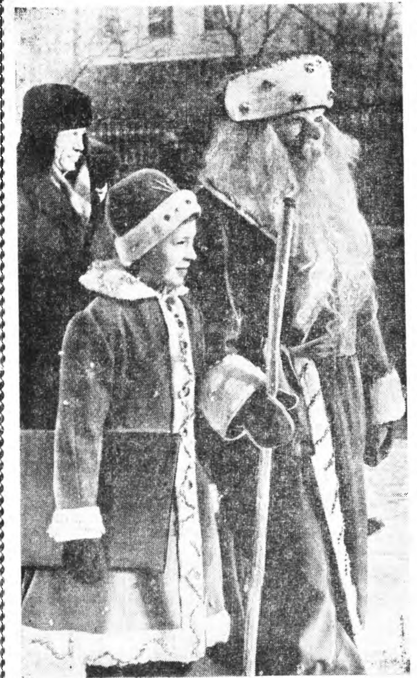
Үгбэн Мороз ербэл даа.

Е. ХАЗАГАВВА, үхнбүдтэй республиканска библиотекын методист.