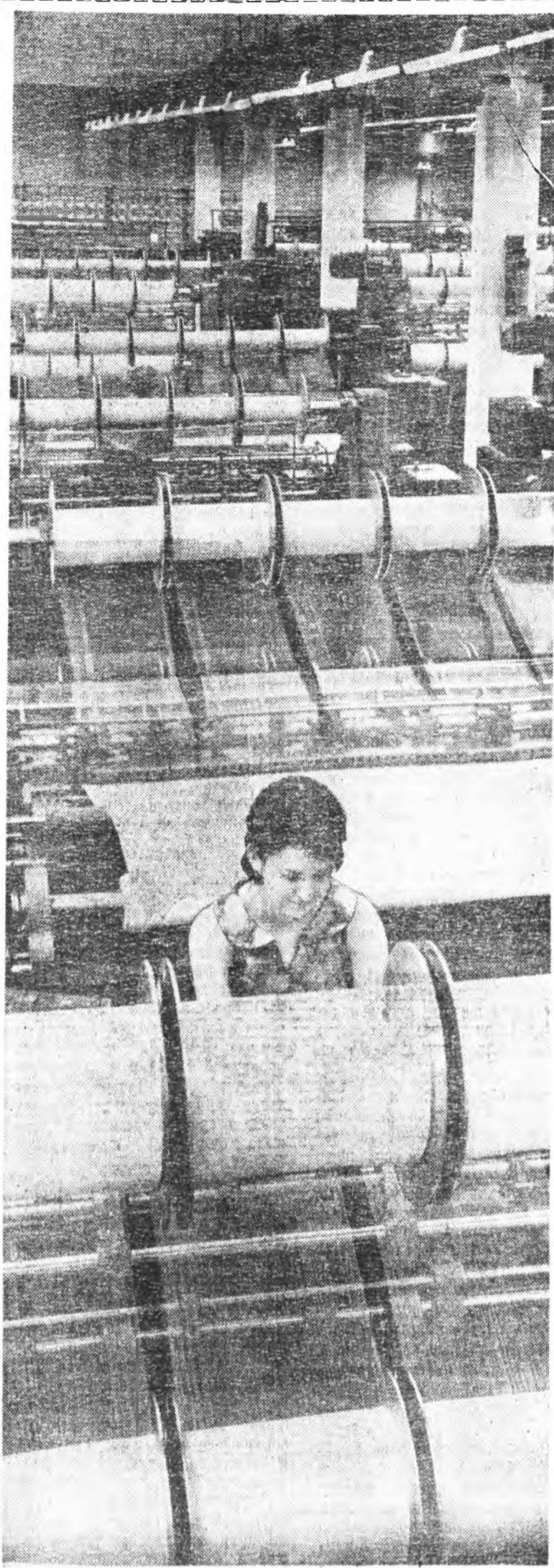
ЭСТОННИН ССР Таллинэй «Марат» гэжэ трикотажна фабрикын шаярхэн хальбэлгэ түгэхэгдэжэ байнхай. Продукци гаргалга эндэ нэгэ хахад дахин нэмэхэ юм. Энэ предрияти продукци бүхы дээрнэ гаргаха жэлэйнгэ түсэбэ декабрийн 13-да дүүргэнэ юм. Фабрикын шаярхэн корпусоо мүнөө үе сагай хүгээ маншанууд табигдайхэй. Энэ хахад бүрнэ хайн шепартай продукци гаргаха арга олгоно. Зураг дээрэ: фабрикын шаярхэн цехэй нэгэн соо.

ҮЙЛЭДЭРИ ДЭЭРЭ болон нийгэм хуульчилгээ шалгаран совет хуульчилгээ эрхэмүүдэй эрхэмүүдэнь өөһэднөө эргэдэ шэлэн абаха, залуу коммунистууды дьэ зүбөөр хүмүүжүүлэхэ түсэбэ партийна организацинуудай шухала зорилгонуудай нэгэнэнь болоно. Зүгөөр мэдүүлэ барнхан лэ хүн партида абаха ёһотой бэшэ. Манай парти өөрингөө ээргые шарайн талар найжаруулхын тула саг үргэлжэ оролдожо, анхаржа байдаг дээрнэ хүсэтэй, хүн зоний дунда ехээн нэрэ хүндэтэй байна шуу. Тинмэһэ партийна зэргын сээр сэхэ байха тушаа анхарха, КПСС-тэ орогшодто шанга эрилтэ табижа, тэднине шэлэн абаха гэһэнэ бүхы партиил, бүхы партийна организацинуудай ажабайдалай хуули заншал бололхой. КПСС-эй XXIII съезд дээрэ тэмдэглэгдэнэйн ёһоор, партиин социальна бүридхэлдэ хүдэлмэришээ анги саашаадаанье гол нуури эзэлжэ байха зэргэтэй.