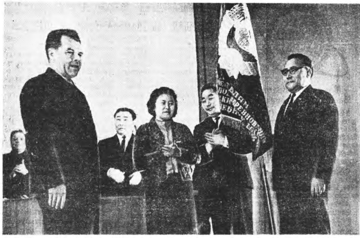
РСФСР-эй Министрүүдэй Сөвөдэй ба ВЦСПС-эй дамжуулгын Улаан туг баруулагдаба.

Гэээрэлэй хүдэлмэри лэшэдэй эдэхитэдэй суглаанһаа