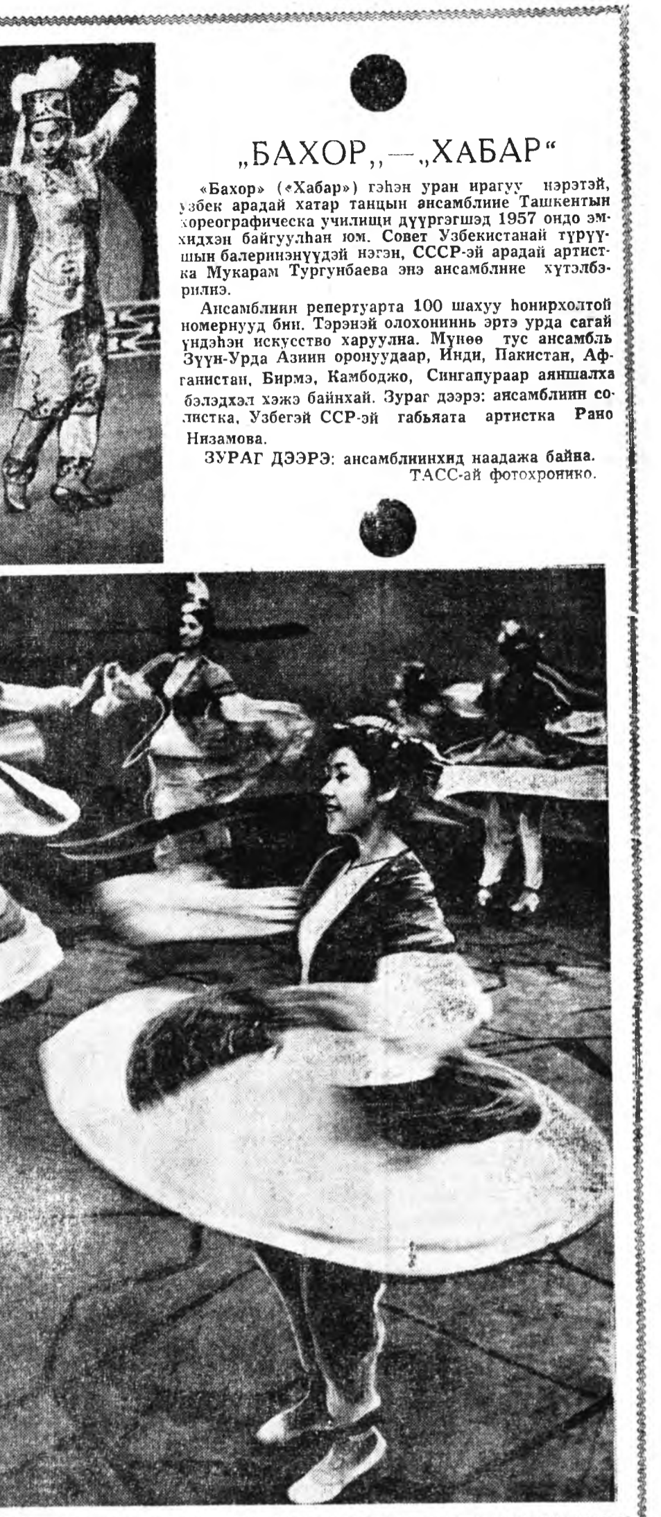
«Бахор» («Хабар») гэжэн уран ирагүү нэрэтэй, узбек арайдай хатар танцын ансамблине Ташкентин хореографическэ училищны дүүргэсэд 1957 ондо эмхилдэн байгуулан юм. Совет Узбекистанай түрүүшын балетизациудэй нэгэн, СССР-эй арайдай артистка Мукарам Тургунбаева энэ ансамблине хүтэлбэрилнэ.

Республиканынай «Урожай» бүл гэмэй хуураг хонкей наадагд профессоруудай үбэлэй спартаки адны наада үргэлжэлдүүлэ. Энэ му рысөөндэ Ахын, Түхэнэй, Кабан скийн, Хлагтын, Сэлэнгийн, Зага райн, республикын хонкей наада гдлай мурысөөнуудэ нэгэтэ бэй нэжэ чемпион яобан Хорини ко манданууд хабаадласа. Хорини, Түхэнэй аймагуудай команданууд түрүүшынээ уулза гдануудта байнаар, чемпинон нэр дэ хүргэжэ болоозор үрэ дүнтэй гөөр наада. Хоринийхид Сэлэн-Дүү мын РМЗ-гай командэ 10:0, түн хэнэйхид Загарайн командэ 6:0 гоотоогоор шүүэн байдаг. Кабанскийн Ахын аймагуудай команданууд уулзага шанга наадаглар үргэлжлэхэ. Гэжэ наа, кабанскийнхидыг нүгөөдү лэ 4:3 гоотогоор иланан байна. Наадаг үргэлжлэхөөр, Зураг дээрэ: сэлэнгийнхидэй воротгай дэргэдэ.