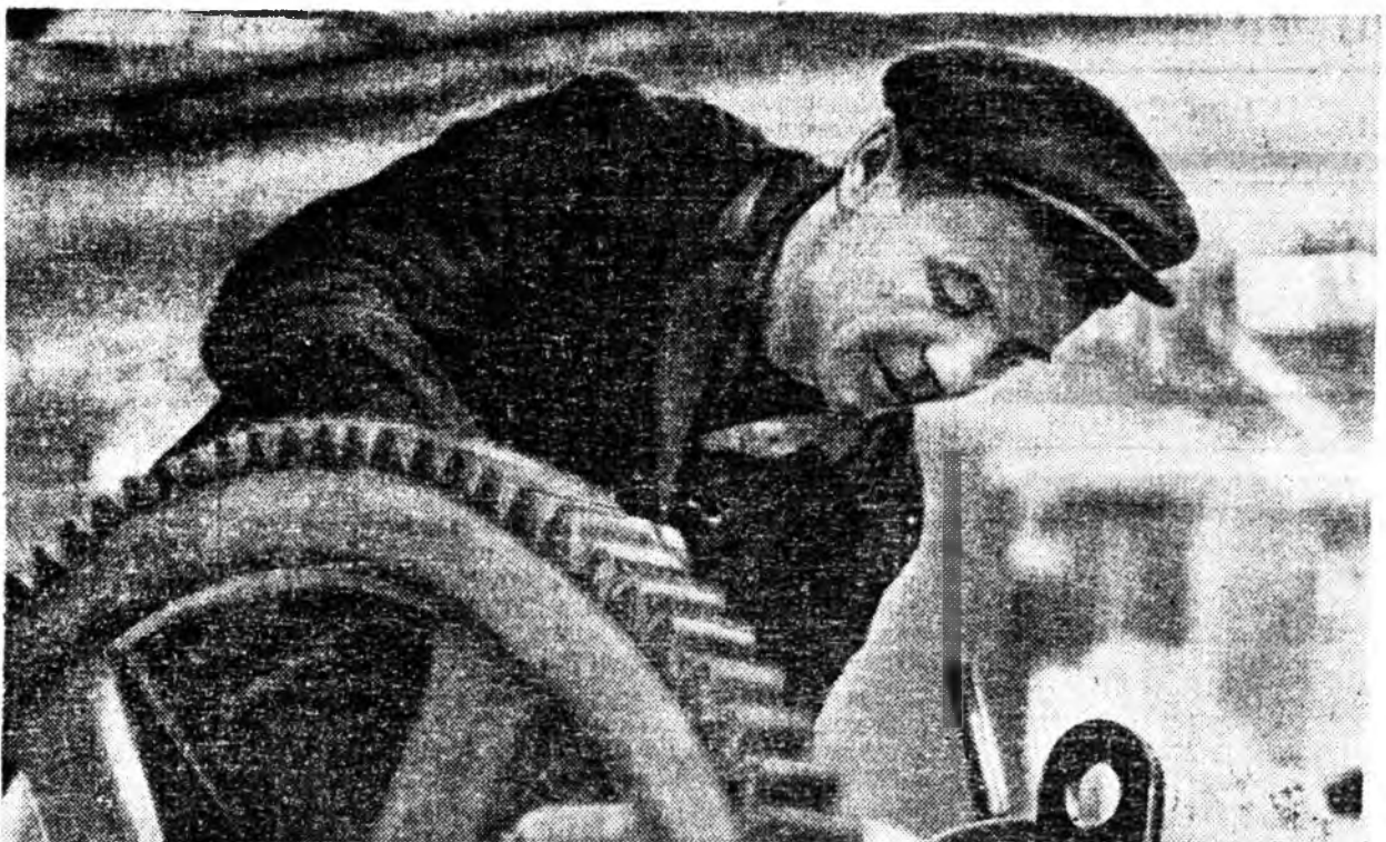
«Электромашинна» завод. Энэ завод шэнэ жэлэй түүрүүшн үдэрөө түсэблэлгн, экономическа урмашуулгын шэнэ гуримда оронхой. Үйлэдбөрээ ашаг эхэтэй болгохо тэмсэлдэ хүдэлмэришэн бүхэн хабаадана. Тэдэнэй олонхины ажалангаа бүтээсэ дээшлүүдэжэ, даа-барлаа ходо үлүүдэн дүүргэнэ.

Мастерской соо тракторнууд эл-набарилгадалда байна. Видэнэй хараһаар байтар нэгэ томо энжээ-тэ трактор хуучиндөөр гаржа ябашаа. Энэ ойгохогүй һам даа, эндемнай машинин будаа барилдадаг. «Эмшэлдэгдэг» газар ха юм. Тээд «амбарлан» гэхэ гү, али худалаа бэрхүүдэн тракторнууд хаана ошоног? Мунго дээрэ шаринаар табигдан, харин соогур жарылдажэ байгаа юм бээ. Халуун хүдэлмэрин хана улахагүйл ерэхэ байха. Хэбэрэй нгабары дулаан үдэрүүдэй нэгэндэ адэ тракторнууд хойно хойноо жарилдан гаржа, гаралан дээрүү гээсэ эхэхэ—хахалда, бор-лойдхо, тарилга хэжэ ха юм.