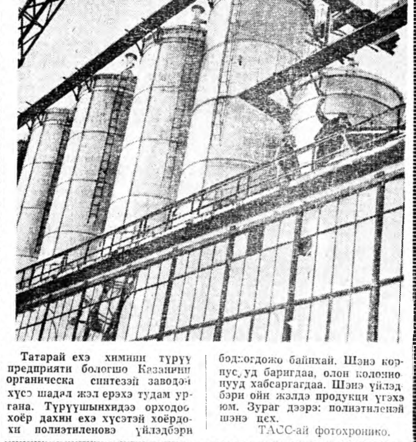
Татарай эхэ химини түүрүүшн предприяти болгошо Кезачин органическа синтезтэй заводо-хус шадл жэл эрэхэ тудам ургана. Түүрүүшнхидэ орходо хоёр дахин эхэ хүсэтэй хоёрдох полиэтиленовэ үйлэдбэри

Узбегэй металлургууд тургэн аргаар булад хайлуулдаг болоо. Тэдэнэр Совет засагай тогтоһоор 50 жэлэй ойн барай худалдада, түсэб дээрэ нэмжэ 3 мянган тонно булад хайлуулжа, 4 мянган тонно прокат гаргаха гэгэн уялга абаа.