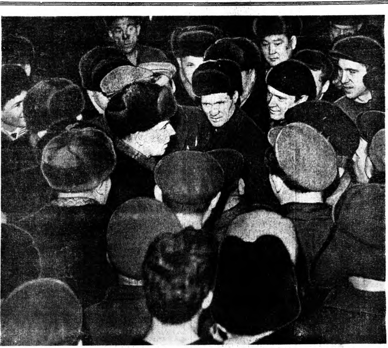
ЗУРАГ ДЭЭРЭ: КПСС-эй ЦК-гай Политбюрогой гешүүн, СССР-эй Министрүүдэй Советэй Түрүүлгэшин Нэгэдэхи орлогшо Д. С. Полянский Улаан-Удын ЛВРЗ-гэй худалмэришэдэй дунда.

Улаан-Удын локомотив-вагон заһабарилгын завод манай республикын хуушанай предприниудайн нэгэн юм. Эндэ олон мянган хүнһөө бүридэһэн коллектив ажаллана. 1936 оной сентябрь соо завод түрүүшынгээ продукция гаргажа эхилэе һэн. Ажалай амжалта туйлаһанайнгаа түлөө тус завод 1948 ондо Ленинэй орденотор шагнагдаа юм. Хоёр жэлэй саана шэнэхэдгэн хубилгаданайн удаа завод электровоз болон тепловозуудые заһабарилган гаргана. Мунөө үеһэ ЛВРЗ Эхэ оройнотгоо зуугаад гаран предприниудайн нягта холбоотойгоор ажаллана, олохон заводууде запасной частынуудаар хангана.