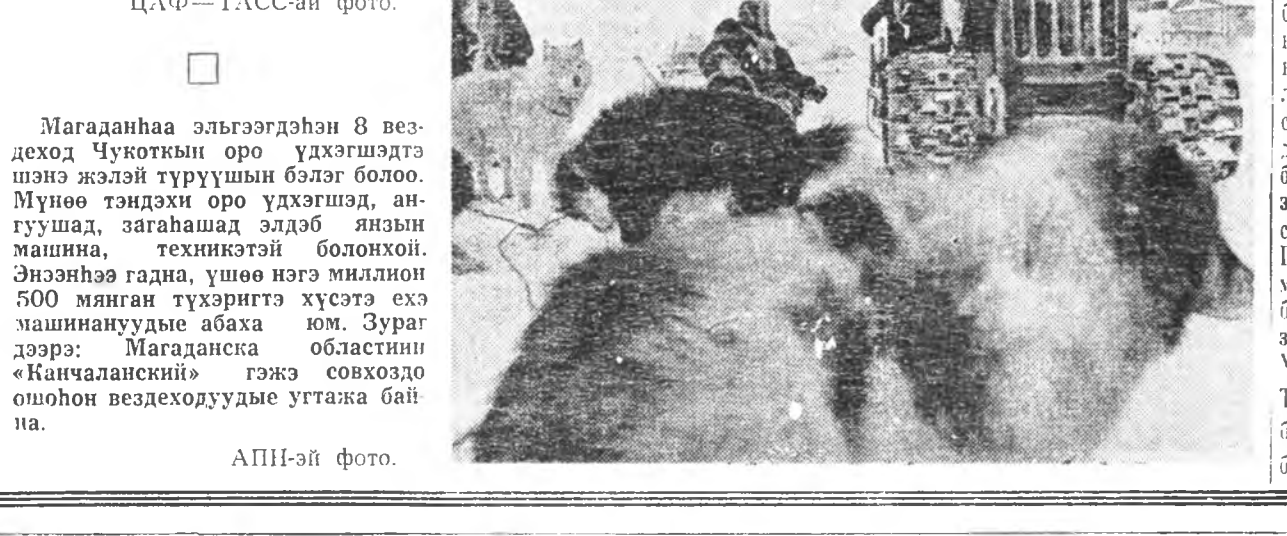
Магаданһаа эльсэгдэнэ 8 вездеход Чукоткын оро үдхэгшэдтэ шэнэ жэлэй түүрүүшын бэлэг болоо. Мүнөө тэндэхи оро үдхэгшэд, ангуушад, заһаһаһад элдэб янзын машина, техникэтэй болонхой. Энэһэнгэ гадна, үшөө нэгэ миллион 500 манган түхэригтэ хүсэтэ эхэ машинануудые абаха юм. Зураг дээрэ: Магаданска областини «Канчаланский» гэжэ совхоздо ошонон вездеходуудые утгажа байна.