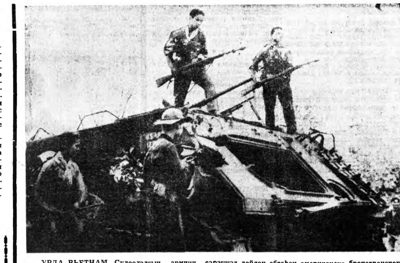
УРДА ВЬЕТНАМ. Сүлөөлэгын армиян сэрэгшэд дайлан абтаһан американска бронетранспор-тёрый хажууда.

ЭРГА ДЭЭРЭ: Хүдэрн-Сомон тосхондо хаяхан нээгдэнэ Куль-ордон.