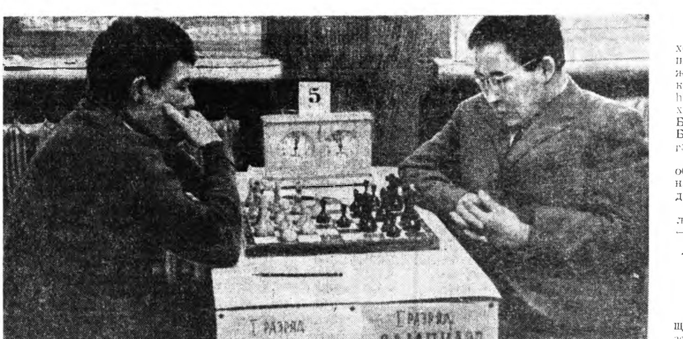
Шэтын шатаршан Сухих Бурадад шатаршан Сампилов хоёр хюлгын байлдаанда.