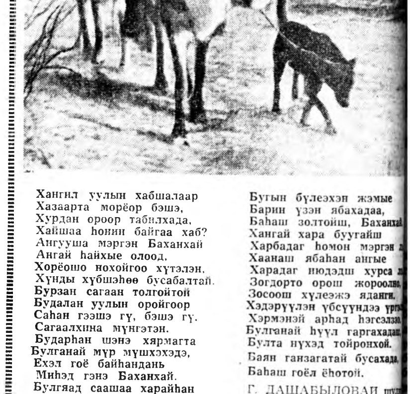
Бутын бүлэхэн жэмье Барин үзэн абахада, Буһан эолтойш, Ваханай Хангай хара бугайги Харбадаг һомон мөргэн Хаанша ябаһан аныя Хардаг нодод хурса Зогдорто орош жоорой. Зосош хүлэжэ ядагы. Хэдэрүүлэн үбсүүндэ үр-Хармэний ариад һаргала Булһан гуйл гаргахалы Булһа нүхэд тойроһон. Баян ганзагатай бусахам. Баһан гоёл ёһотой. Г. ДАШАБЫЛОВАН шр

Хангил уулын хабшалаар Хазаарта мөрөөр бөшэ, Хурдан ороор табилхада. Хайшаа һонин байгаа хаб? Ангууша мөргэн Баханхай Ангай һайхы олоод. Хорёшо нохойгоо хүтэлэн. Хунды хубишөө бусабалтай. Бурзан сагаан толгойтой Будалан уулын оройгоор Саһан гэшн гү, бэшэ гү. Сагаалхина мүнгэтэн. Бударһан шэнэ хармагта Булһан мур мушхэхэдэ, Ехэл гоё байһандаа. Мингэд гэжэ Ваханхайн. Булһаад саашаа хархайһан