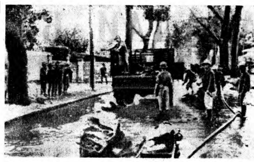
Америкэнэ урда Вьетнама байдаг америкэн сэрэгэй командлагын штаб-квартирые Урда Вьетнамай патриотууд февралын 13-да буудан байгаа. Командалагта генерал Уэстморлендын штаб-квартира Сайгоний түб дунда байдаг юм. Үйлсөөр ябажа байһан америкэн парашютистуудай ашаанай машинны дэргэдэ хэдэн снаряд тээрээ, 10 америкэн ажалууда, 5 хүн шархатаа. Зураг дээрэ: Уэстморлендын штаб-квартирын дэргэдэ, тэрэни Урда Вьетнамай патриотуудай бууданаһан һүүлээр.

ПНОМПЕНЬ, февралын 20. (ТАСС). Америкын болон Урда Вьетнамай бүтэг солдадууд Кеет (Свайриенг провинци) район шадар Камбоджны газар дээрэ гүй-зэгрэн оржог. Илн дээрэ хүдэл-жэ байһан тарлашаае буузаа гээд США-гай правительствана Камбоджны МИД-эй эльгэзхэн бу-руушаалтын ното соо мэдээсэгдэ-нэ. Кампо провинцидхн Компо-нгуал гэжэ Камбоджны тосхоние Америкын болон Урда Вьетнамай сэрэгүүд февралын 6-да бууза-һан байгаа. Тийхэднэ нэгэ та-рашан горийгоор шархатаһан байха юм.