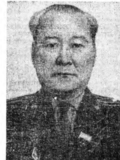
ЭРДЫНЬЕВ Даша Ринчидор-жиевич — Буряадай АССР-эй Нийтин гурим сахиха министр.