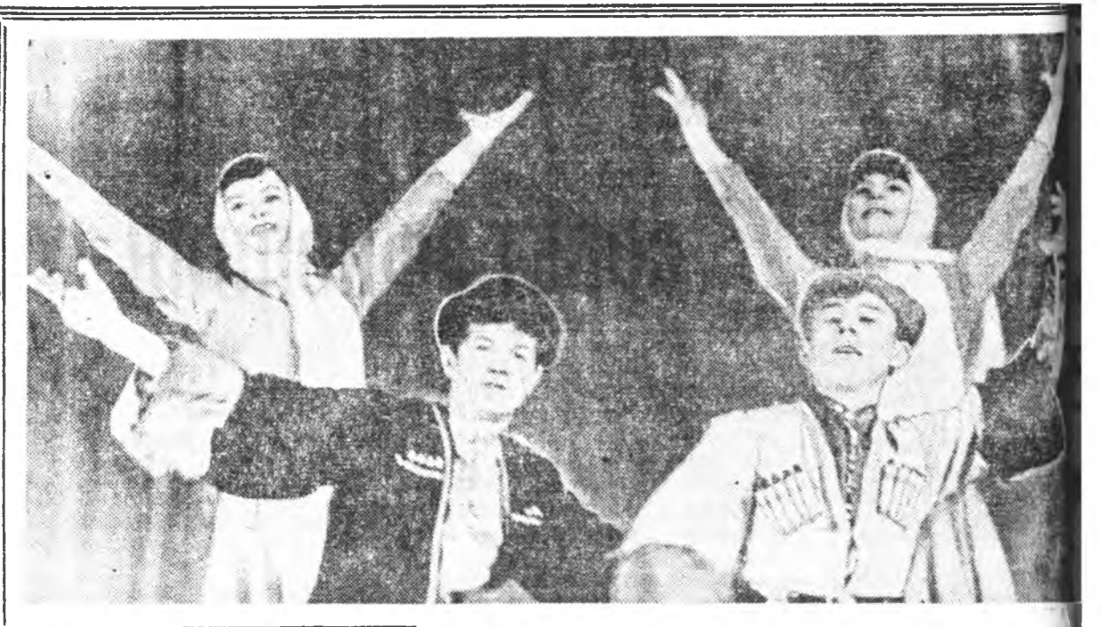
Октябриин хубисхалай 50 жэлэй ойдо