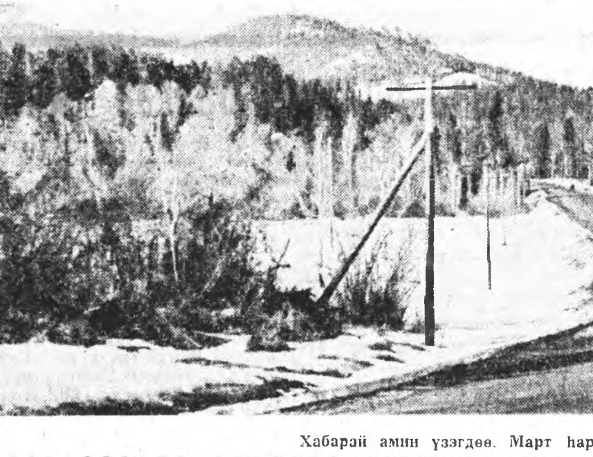
Хабарай амин үзэгдөө. Март харын эхин.