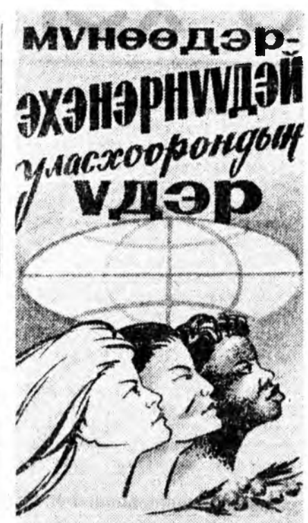
Мүнөөдэр эхэнэрнүүдэй уласхоорондын үдэр

Уласхоорондын эхэнэрэй хүдэлдөөнэй совет эхэнэрнүүдэй үүргэ ехэ. Бухы дэлхэй эхэнэрнүүдэй түрүү организацинуудтай тэвэрэй холбоо барисан жэлдэ жэлдэ бэхжжэнэ.