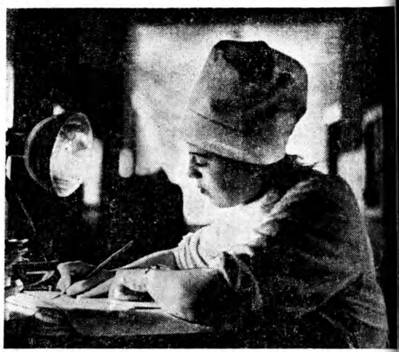
ШЭНИНСЫН ЗАЛААНУУД