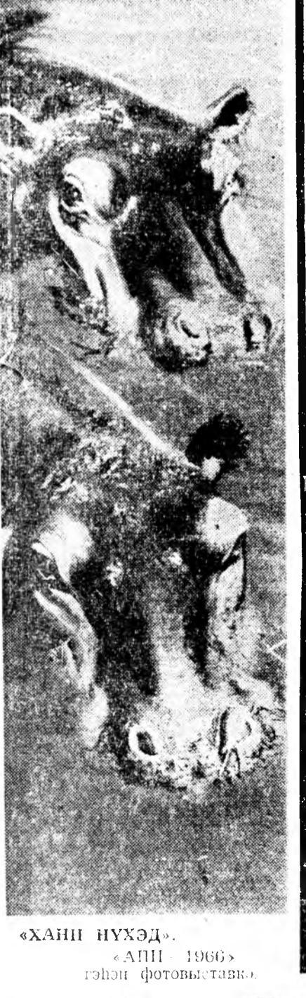
«ХАНИН НУХЭД». «АПП 1966» гэгшэ фотошанга.

эрвэдэнэ. Мүнөө баабтай амандаа 1—3 хү-рүүдэ гарганхай, хубуудын бөөшнй шонин байдаг. Халдгай болон буга шижэ хүлэ бөрөлжэ, улангир модотой талдта байрладаг. Халдгайны эбэр уни унаханай, тинхэдэ буга үшөөл эбэр-тээ ябана. Гүрөөнд саһа багатай бэлээрн дахажа эрөөнэ. Гүрөнү-дэй эбэр унала захалаа. Мартын тэнгаар буринше дуула-болон, модоний наама мунарта тог-тоһон саһан хайлажа унаа. Тала газарай саһан эрэлжэ сохордоо. Дулаан үдэрүүдэ хэһэн майдэ гүбөөнүүдэр бэлгэһон мал хүйгэй хүхэлбэ эрэлжээдэ мундэлэн ха-ратдаха.