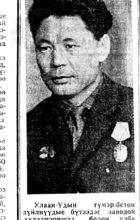
Улаан-Удын түмэр-бетон зүйлнүүдые бүтээдэг заводой хүдэлмэринд болон алба хаагша Агууехэ Октябрин социалис революциин 50 жэлэй ойн ажалтай бэлэгүүдээр угтахала тэмээнэ.