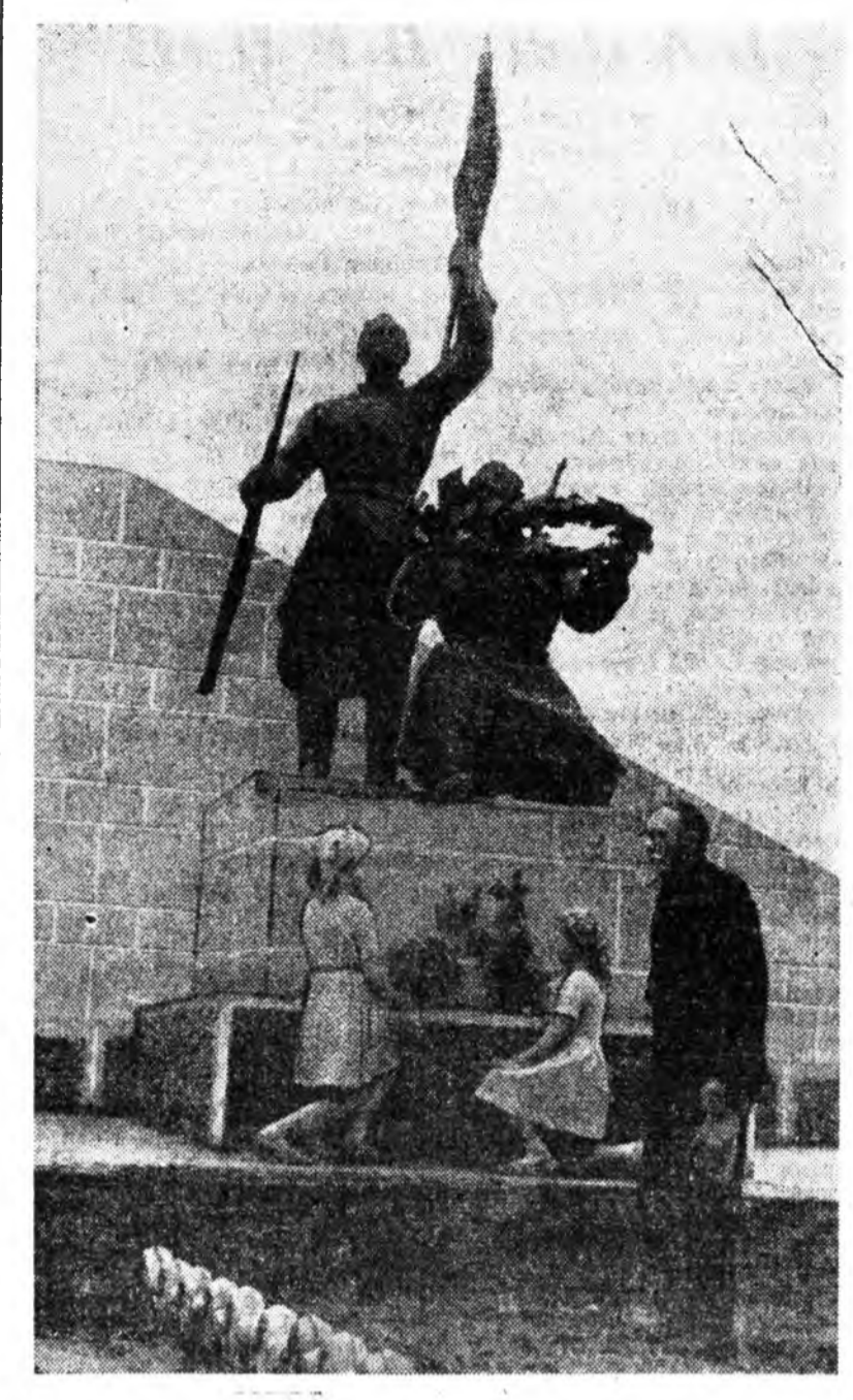
«Партизануудта хүшөө» С. ЦЫДЫПОВЭЙ фото.