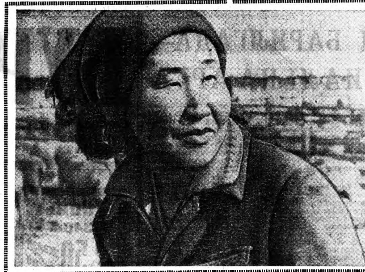
Ухибуудые хүмүүжүүлгэ—бүгэдэ арадай хэрэг ✓