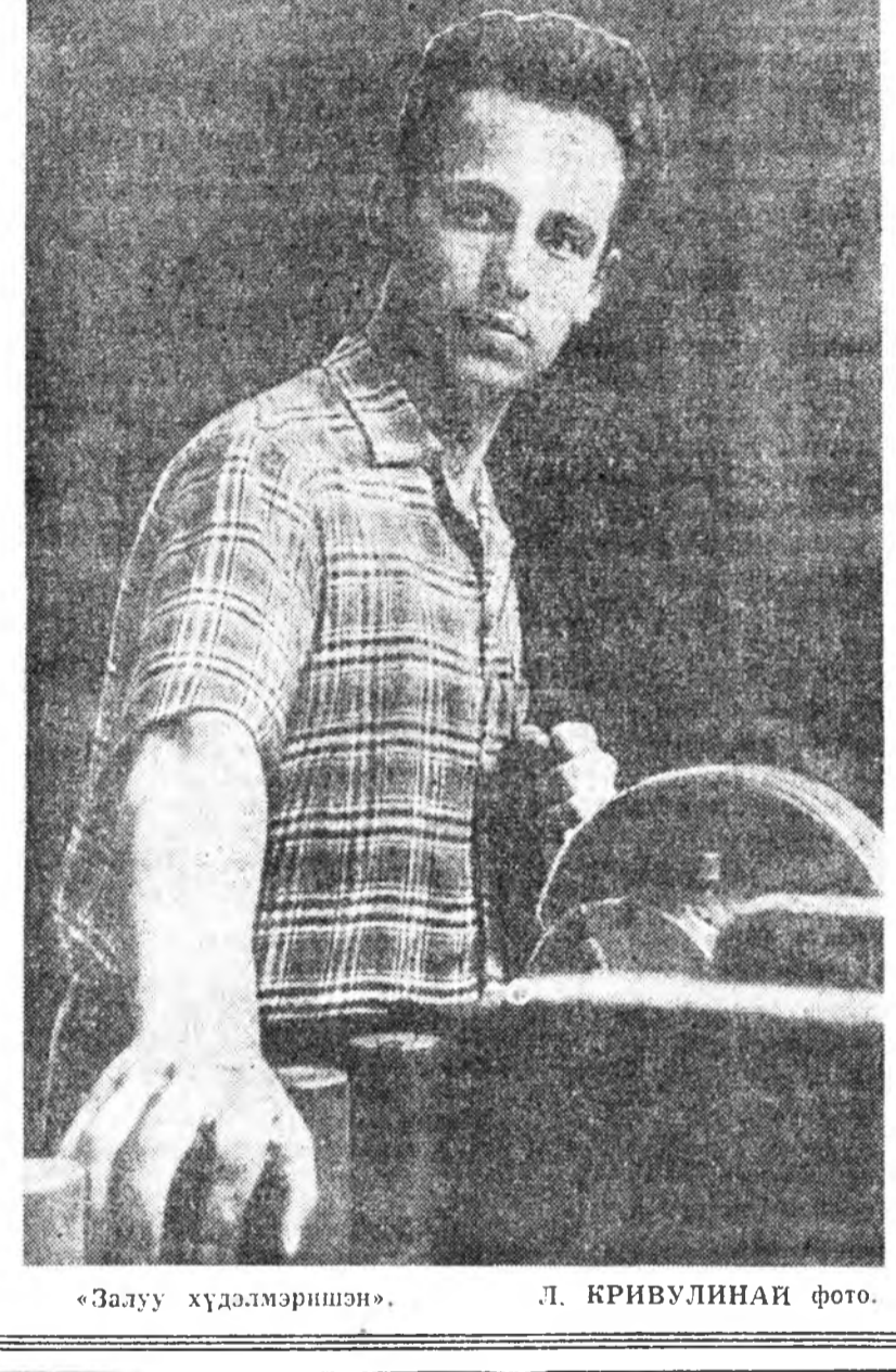
«Залуу хүдэлмэршэн», Л. КРИВУЛИНАЙ фото.