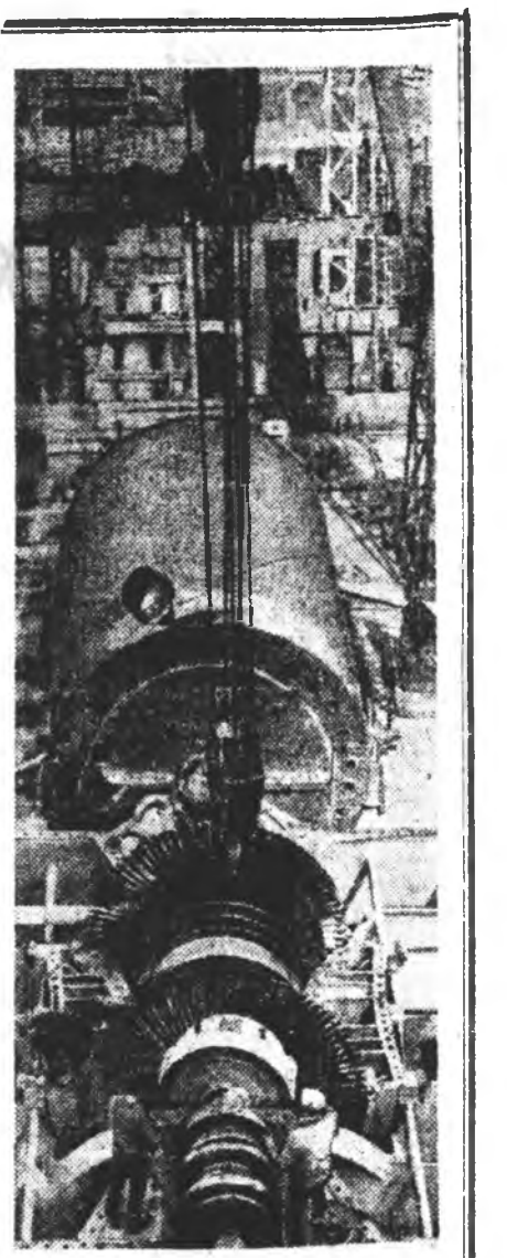
Газ хэрэгжээдэ Ташкентин ГРЭС-эй барилдажа дүүрэхэдэ 2 миллион шаху киловатт хүсэртэй болохо юм. 5-дахы турбогенераторын промышленна дааваря дүүргэжэ эхилээ.

Дэлхэйн коммунист хүдэлөөндөйл өршөн байдалта, тэрэнэй зурлыг нэгтгээр жагсааха хэмжээнүүдта хамаатэй хэдэн олон асуудалтуудтар, таршадан мүнөөнэй үрсэлүүдэн байдалай шуухал түгтүүлүүдээр хөөрөлдөөнэй үедэ өнөөдөр наамажуулаа мэдээсэ.