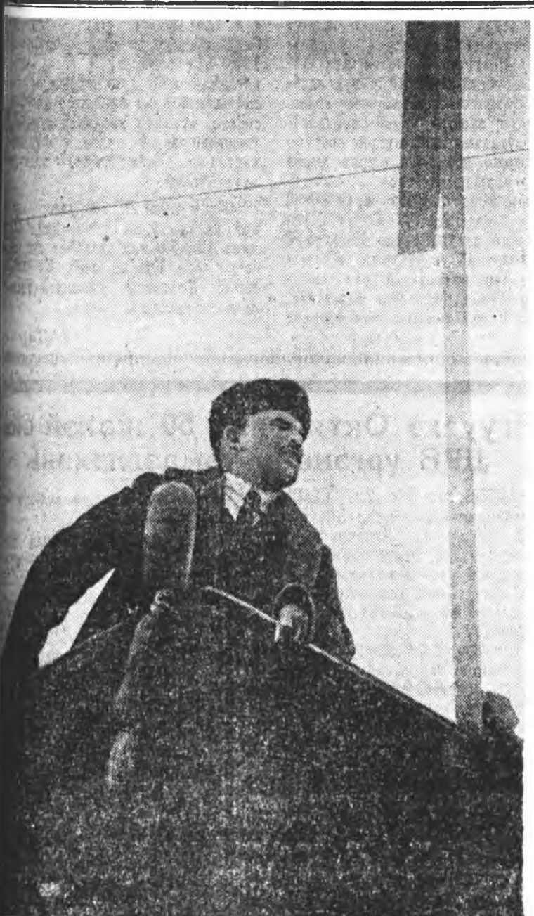
1918 оной ноябрин 7-до Октябрин Агуухэ социалист революциин нэгэ жалэй ойи найндэртэ Улаан тэжэй дээрэ В. И. Ленин үгэ хэлэжэ байна.