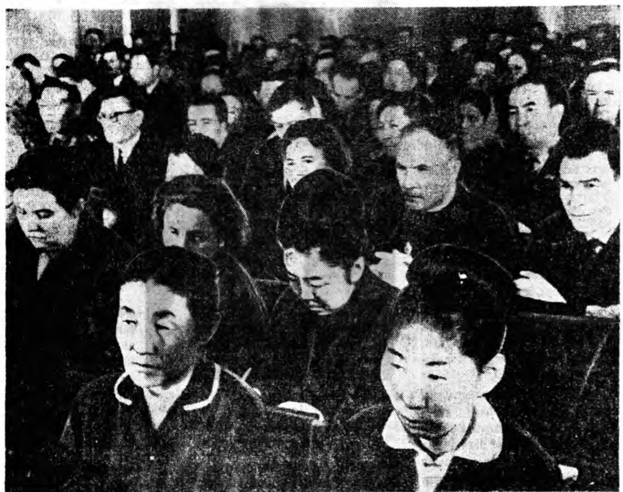
Угсаалар, Улаан-Удэда Бурядай АССР-эй долоодохи зарлалай Верховно Советэй нэгэдэхи сессий нэгэдэби.