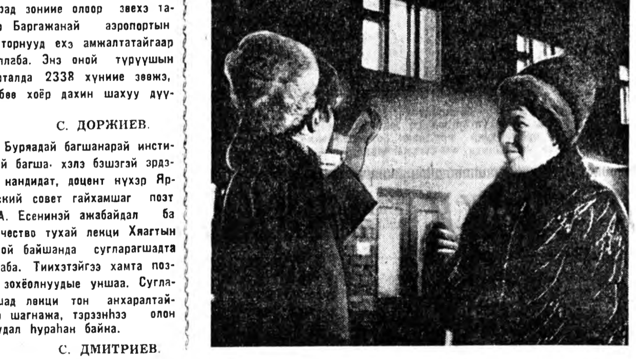
Шэнэ гэрэй гэрэл...

Арбан нэгэархон найхасаньичи үни онхон гэгэ найхасантай на- лаха тухай хэрэг үүдхээгүй бай- ван ушраар тэрэндээ соёлгүй дуртай юм.