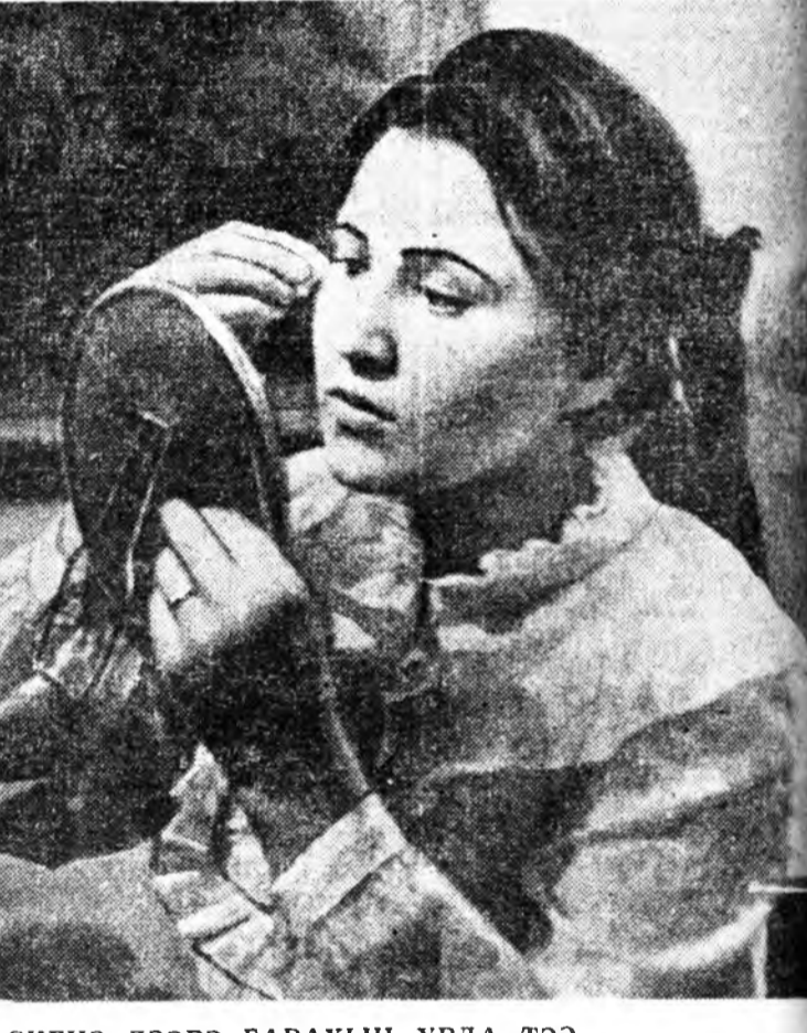
СЦЕНЭ ДЭЭРЭ ГАРАХЫН УРДА ТЭЭ.