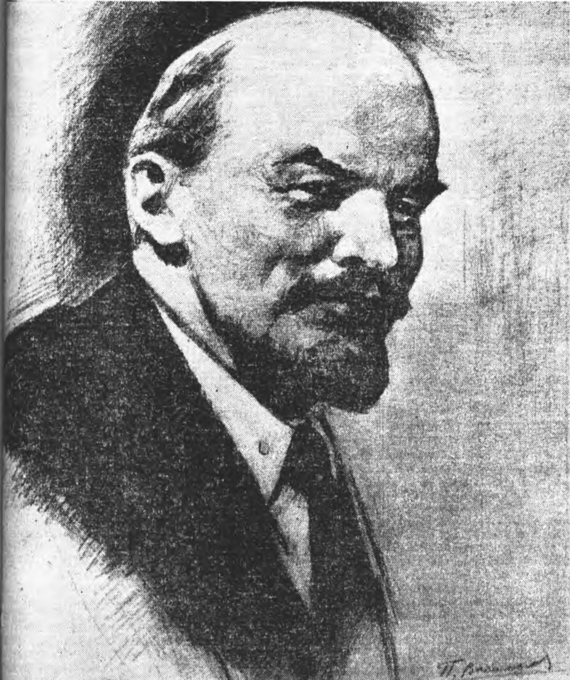
В. И. ЛЕНИН. РСФСР-эй искусствын габыата ажал ябуулагша П. Васильевай зураг.