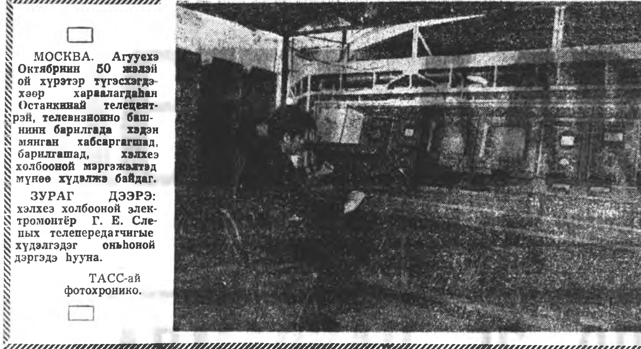
МОСКВА. Агууехэ Октябрийн 50 жэлэй ой хүрэтэр түгэсхэгдэхөөр хараалгадан Останквийн теледидей, телевизомо башнин барилгада хэдэн мянган хабсаргашад, барилгашад, хэлхэ холбооной мэргэжилтэд мүнөө хүдэлжэ байдаг.

Шаналал гашуудалай митинг эрэнэ. Тэрэнэй КПСС-эй ЦК-гай Политбюрогай гашуун, КПСС-эй ЦК-гай секретарь М. А. Суслев пэһэ.