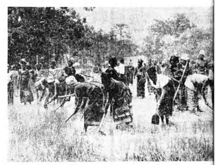
Конгын эхэнэрүүд (Бразавиль) гүрэн турьнөө байгуулалт эдэбхитэйгээр хабаадалсаһа. «Конгын эхэнэрүүдэй революцие Холбоо» гэжэ эмхидэ хамтараад байхалаа, тэдэнэр 1967 онийн а хэхэ үнгэрэхэ гэгшэ Национальна революционно худалмэришад партинын гаргаһан урлаа халуунаар дэмжэн дунгэлсөбэ. Зураг дэ Конгын эхэнэрүүд «хамсыгаа шамдаа ажаллаха» гэжэн социал суботнигто гараад байна.

Хүн зоний оройдоо 7 хубын доторхи зөөри зөөшин 84 процент гартаа бариха байхадань, үлэгшнэй хубида юнцье хүртэхгүйн на ха юм гэжэ худалдаа найма худалмэришадэй тувологшье Уайз гэгшэ мэдүүлбэ. Тинхадэе национальна ашаг олзөөе унэгтэ эр хубаадаг болохо, сэрэгтэй гаргагшэе хэрэгтэ тувөө тэмсэ гүжэ урлалһан байгаа.