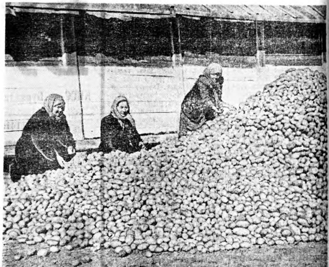
Эхэнэрүүд хартаабхын үрөөнэ шанаржуула, һүүрээна.

Үбэлдөө бидэ звенодо даалгаданхай бүхы техникэе забарилнаби. Харин газарай гэдэжэ захалхатай сасуу поли тарилгада бэлдэжэ эхилэнхэби. Май һарын эхээр поли дээрhэй наг шөбхээ жэгдээр таража, газарта минеральна үтэгжүүлгэ оруулжа эхилэнхэби. Мүнөө хартаабхынаа газар-