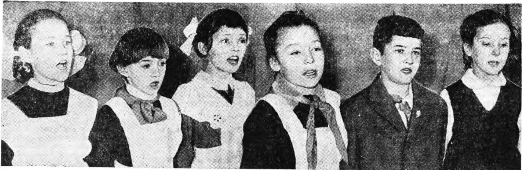
«Совет засагай 50 жыл» гэжэн фото-зурагуудай конкурсдо