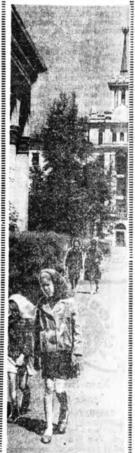
Хонгор сэдхэлтэй Хоёр найхан басгадууд, Улаан галстугтай Улаан сэрэн пионерүүд Түрэл хотынгоо Түүхэтэ гудамжаар ябанал даа. Таригданан сээсүүдэй Тааруу хайханниие харанал даа Газар юртэмсын Габьялта номсанавт болохо гү? Аба орондоо Алмаз, гранит бэдэрхэ гү? Ямар нэгэл Яшагай найхан хүсэлье Ароухан хүгүдэ Абажа лбанал даа толгойдоо...