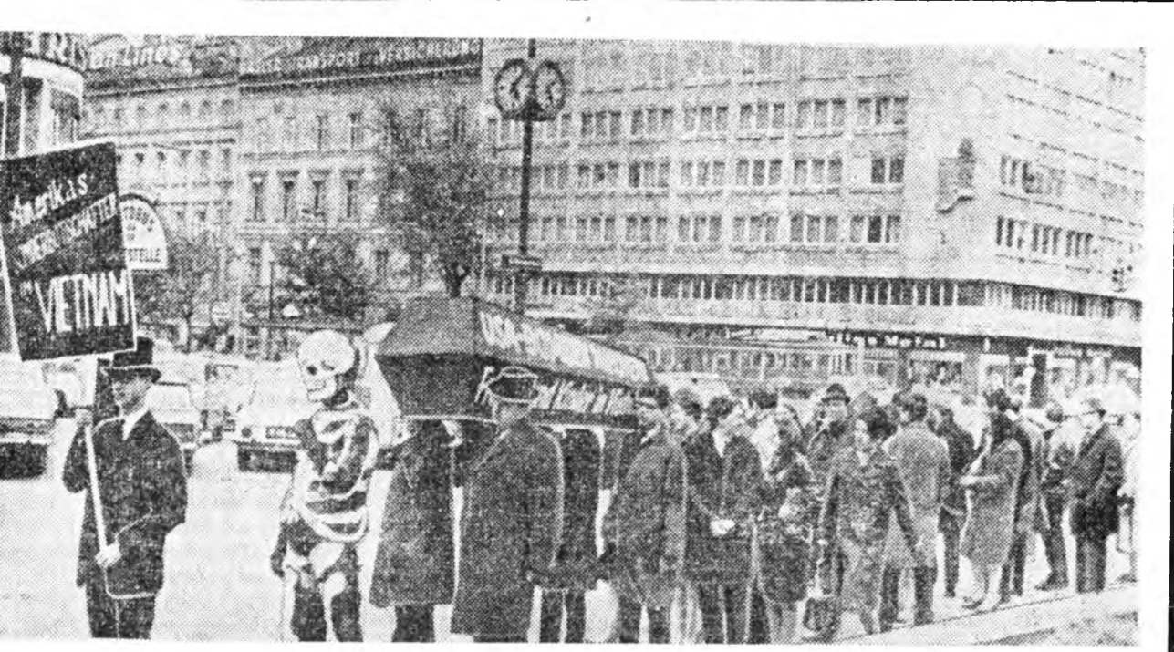
ВЕНЭ Австриин алашуулууд хадаа Вьетнамай газар дээрэ США-гай хэжэ байһан зэрхэг тү-римжэй дайн байлдаа буруушаана. «Вьетнамадхы американ түрлмхэйшүүл хоорон үхэг» гэхэн үг-нүүдтэй плакадуудые демонстрацида гарагшад баржа ябаа.

мандина составтай зүблөө үнгэрөө. Синайһаа Амер Исмаиль орожи, далайн-сэрэгүүдэй хүсэнүүдэй Главно командалагша Солиман Заваттай уулааа. Ирак Египедэй политическэ ко-мандованиин хамтын засединда хабаадалсахаа ерөөн Ирагай де-легациитай президент Насер уула-аа.