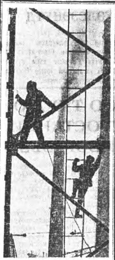
БАШКИРАП АССР. Стерли-тамакса содово-цементнэ комбинат ургэдэгдэж байна. Энэ комбинатай эгээ эхэ барилгануудай нэгэн натрийн би-карбонатай цехэй барилга болоно. Энэ цехэй үйлдэбэрлэл гаргабан продакци хадаа элээ хоолой промышленностида орохо юм. ЗУРАГ ДЭЭРЭ: комбинатай барилга дээр.

Түнхэн нотагай байгали, саргайн уларил онсо өөрн илгагтай гэж тэмдэглэмээр. Илээй ямарыг сага эндэхи уларил түргэн зуура түхэл шарайгаа хубилгаж байдаг. Энэ ушар байгалин үзэгдэли мэдэхгүй үбэгд, хүшлэдэй дунда элдэб янзын үзэг, энээнээ уламжалан бурхан шажанда мургэж, бүгэдэхэ ябадал үзэгдэнэ. Бурхан шажанда эсэргүү хүдэлмэри ябуулхадаа, бидэнэр нэн түрүүн нотаг бүхэнэйгөө имэжүү, онсо өөрээ илгээс хараадаа абанабди.