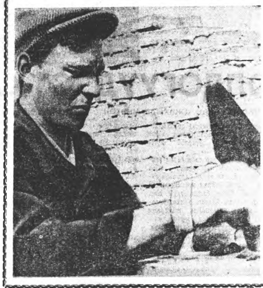
«Буряад үнэндэ» бэшэһэнэй һүүлээр