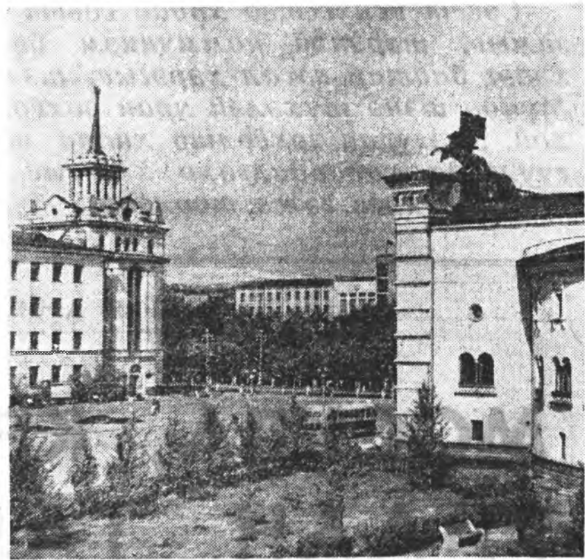
Улаан-Удын Ербановой нэрэмжэтэ гудамжа.