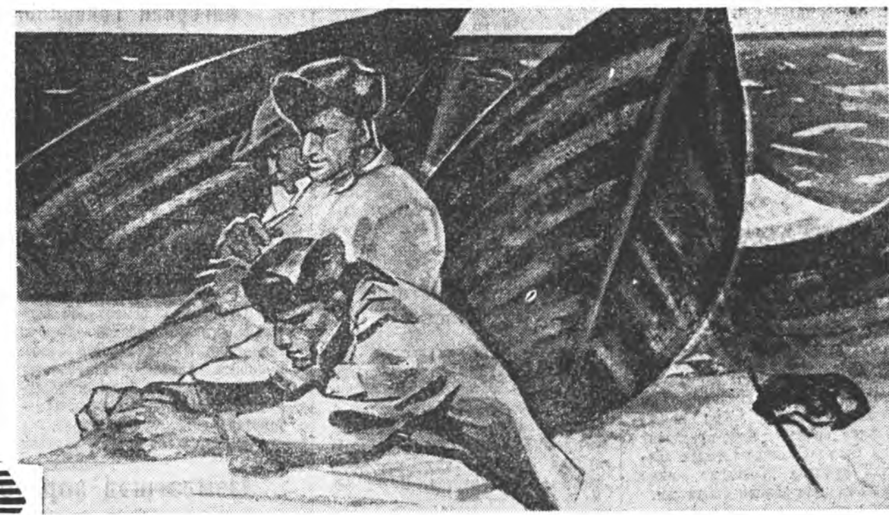
«Байгалай заганашад» гэгэн А. КАЗАНСКИИН зураг.

Отгоргойн мүнгэн мүшэдэй дунахдал, Омогорхон харанаб, нодьмем харгаана. Анхилма байхан үргэн дайлаар Аалихан нэбшээлнэ харбарай халхин. Илдамхан залуухан янаг шамаяа Ирагуу дуугаа дуулахыш уринаб.