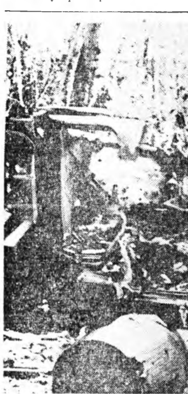
УРДА ВЬЕТНАМ. Тайнинь провинцидахи сүлөөрэлгын армин сэрэгшэд буудажэ халгаанан американ М-113 гэжэ бронетранспортерой хажууда ерээд байна.

Городой урлан араб захиргаанай элнэ ехэ түлөөлөгшдөө Израилин засагаархид ороной эдлэб хубинуудта үнэргэгнэ нелсидэ сүлэн эльгэсэн байна. Тэднэй тоодо «Израильда жэргүү ябуулаха хэжэ гэмнэгдэн Иерусалимт губернатор бии.