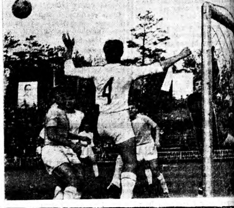
Хөрлөхи хахал. Айшаад олоо- В. ОЛЬХОВАТСКИЙ.

Энэ НААДАН футболдо дуратайшуудыг илангаяа эхэтэ хонирхуула. Юуб гэхэд, айшаар ерөөн Юселевскийн «Шахтер» урда жэлүүдтэ манай «Сэлэнгэ» командата ороходо бираггүйгөөр наададаг, хүүлшн хууринуудай нэгые эзэлж ябадаг байн.