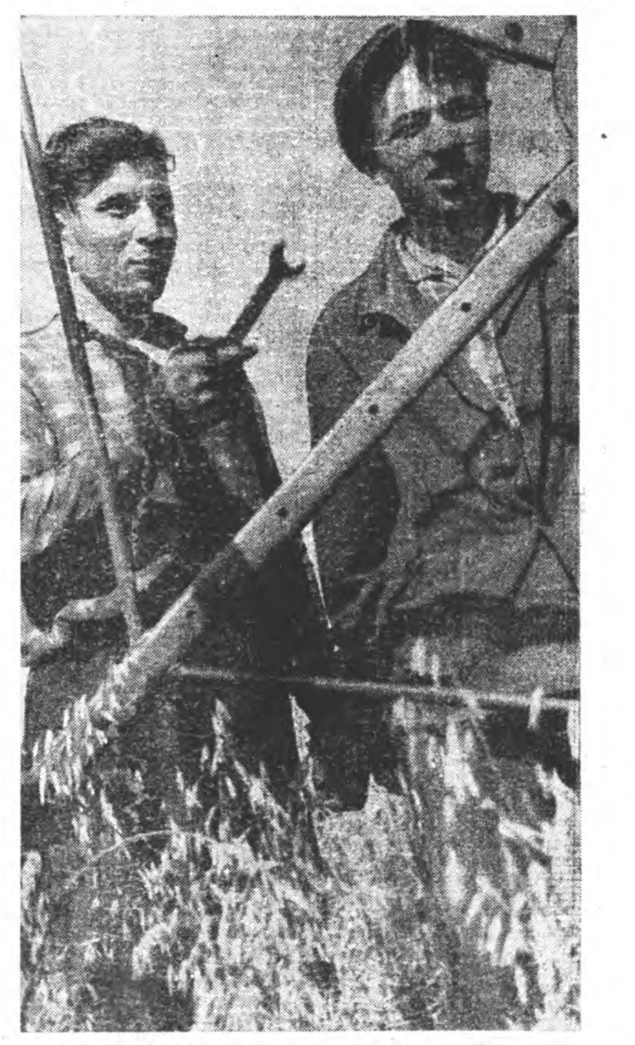
Тэжээл бэлдэхэ эгээн харюусалгатай үс. Кабанскыи совхозой 2-дохи отделенидэ энэ худалмэри түлэг абуулагдажа байна...