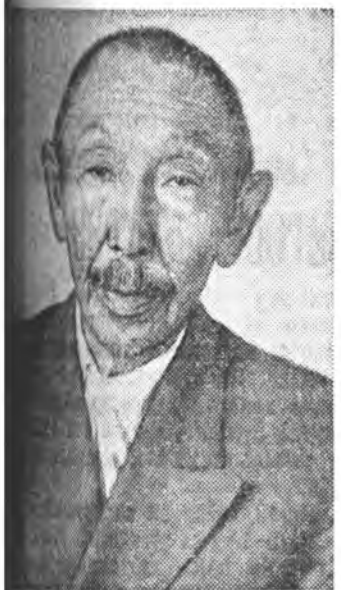
Хүрээтэй Юрээтэй дунда хур- гийн багш байсан хүчэр Дор- но Д. Н.