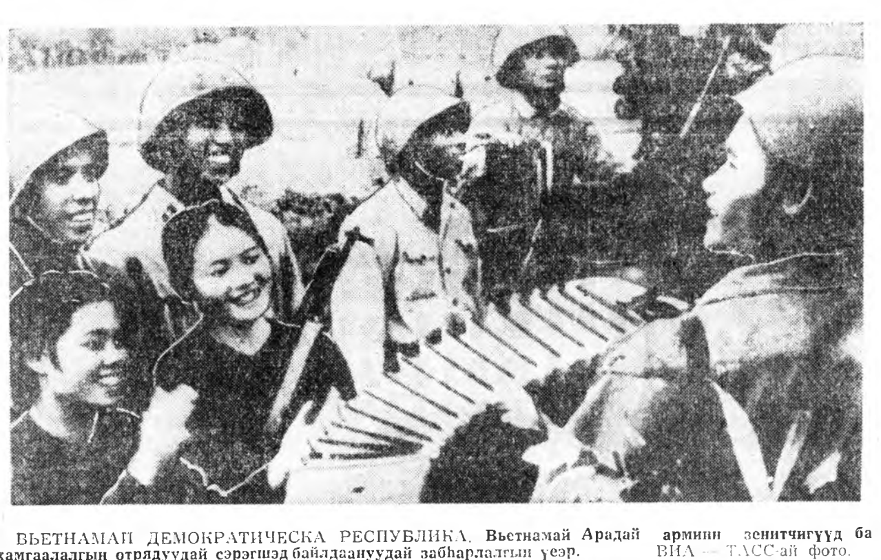
БЕШТАНАМ ДЕМОКРАТИЧЕСКА РЕСПУБЛИКА. Вьетнамй Арадай арминь асентичүүд ба хамгаалтын отряднуудай сэргиндэ байлдануудай забһаралтын үеэр.