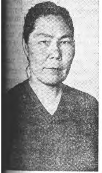
Габьяата багша, му- шугуулидаа хүдэлдэг хүчэр А. Р.

1935 ОНДО манай институт эм- хидхэдээ нэн. Харин мүнөө 250 багшантай байна. Энэ бүгд—арадай гэгээрэл ту- шаа Совет гүрэнэй анхрал, абыас гаралтай аша үр мүн. Институдтай арад зонойнгоо аша тушаа мүнөө угаагч эх аба хэнэ: улам баян ургасаа хурдаг, шэнэ ургамалнуудыг эмдэг тардаг бо- лохын тула бүхы машина, техни- кээ бүтээс эхэтэйгээр, чирин манеинаар ашаглажа хурхын, үхэр малайнаа үүлээр найжа- руулжа, ашаг шэмын элбэг дэм- бэг болохын тула нилээдхэн эх шэнжээлэгийн хүдэлмэри ябуула, хэдэн олон мэргэжлэдэе хурган гарана. Бүхы юумэн—арабайнаа аша тушаа! Тодорхойлууд: газар таряалан- гай факультэдэрин республика доторо эрдэм наукаг ёноор газар таряалангаа яагаад эрхилдэг болохо тухай асуудал шийдэнэ. Тухайлбал, аймаг аймаг газар