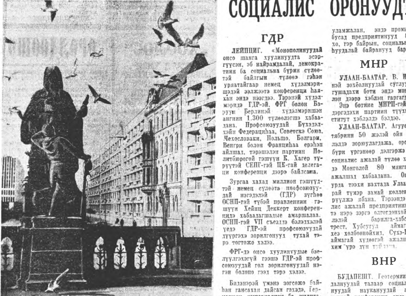
БЕРЛИН. Германиян Демократическа Республннн нинслэл хото жэлнэ жал бүхэндэ урган халбарна. Жэшээлхэдэ, Гертруденбрюке гэжэ хүүргэ дээрэнэ харахада, байрын гэрнүүд (баруун гарнаа), Гадаадын хэрэгүүдэй министртын ордон эхэ гөбөр харагдадаг юм. Урданай архитектурн хүшөөнүүдэй саагуур шэнэ үндэр гэрнүүд эрбылэн харагдана.