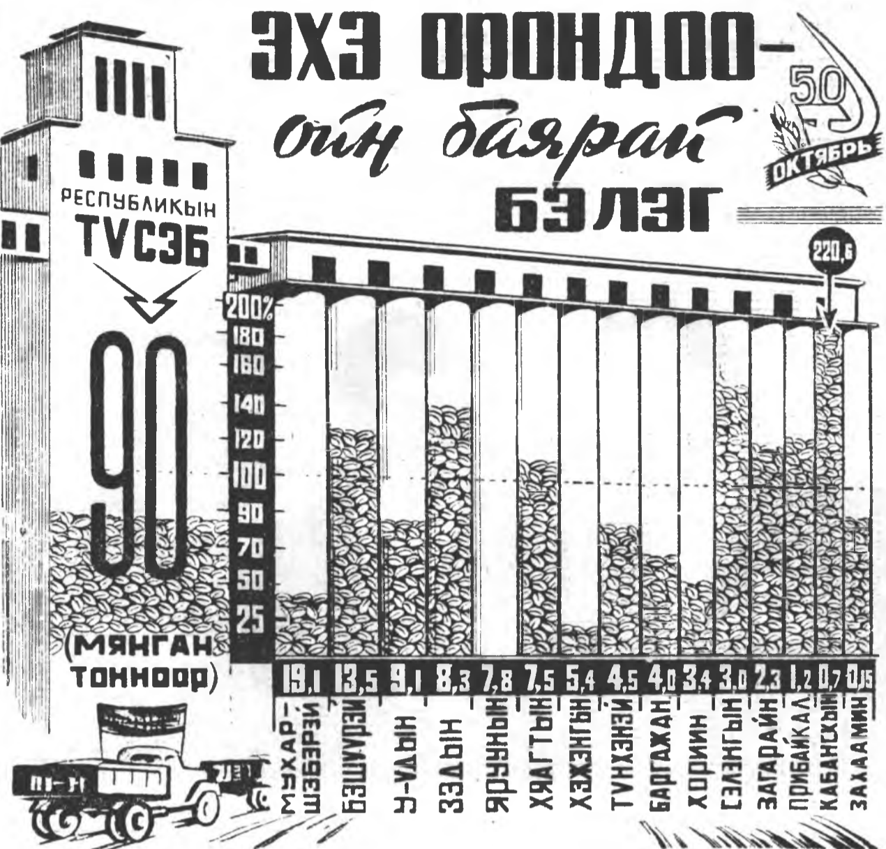
Гүрэндэ тарьяа худалдаха түсэбөө республикын аймагуудай хэр дүүргэжэ байхан тухай (сентябрин 20-ной мэдээн)