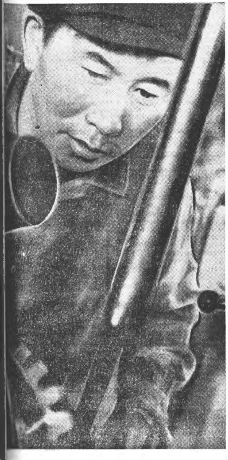
Тайландын сэрэгүүд Урда Вьетнамад бууба ЛОНДОН, сентябрьн 22. (ТАСС). Мунөөдөр Сайгондо 2200 хүнтэй Тайландын сэрэгүүдэй түрүүшын бүлэг бууба гэжэ Рейтер агентствын корреспондент мэдээсэ. Тингээд эрхэлээрэ, Тайландт гэгээ США-һаа гадна Урда Вьет- нам руу өнөөдүнхөө сэрэгүүды эл- гээшэн табдахаи орон болохо. Урда Вьетнамай патриодуудта сэрэгүү ээрхэг түрмхэй дайн байлдаанууд- ыг америк сэрэгүүдтэй хамта хэнэ.