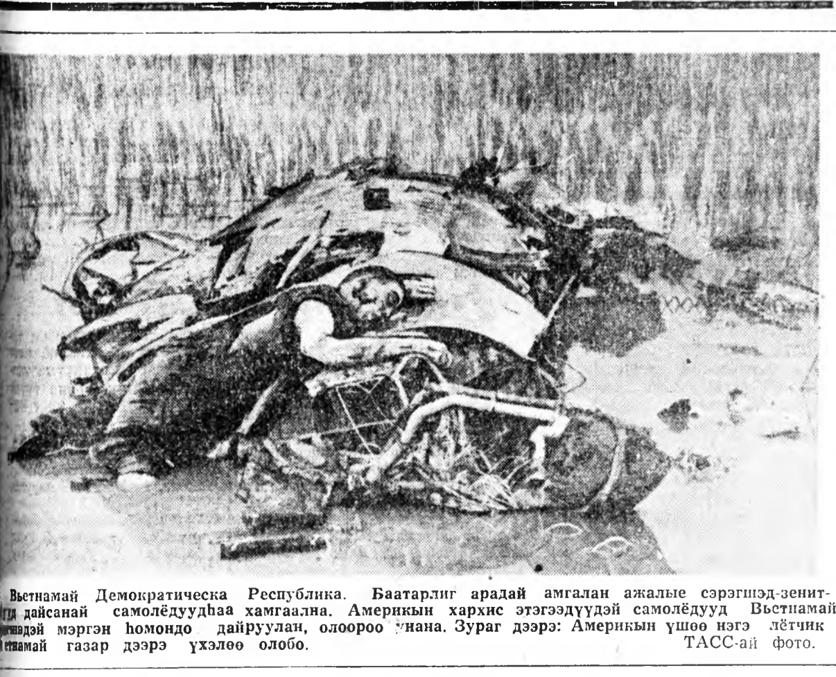
Вьетнамай Демократическа Республика. Баатарлг арайды амгалан ажалые сэрэгшэд-зенит-гай дайсанай самолёдууднаа хамгаална. Америкын хархис этгээдүүдэй самолёдууд Вьетнамай мөргөн хомондо дайруулан, олоороо янана. Зураг дээрэ: Америкын үшөө нэгэ лётчик гетнамай газар дээрэ үхэлөө олобо.

Сэрэгэй алба хаагшад, мүн хуралсаай спорто татагдаһан сэрэгэй ялгата зон СССР-эй Конституциин ёһоор хараалагдаһан совет хүнүүдэй эрхэ болон уялгануудые гүйсэлээр элдхэ эрхэтэй гэжэ шэнэ хуулиин проект соо хараалагдаһан тухай А. А. Гречко тэмлэгдэбэ.