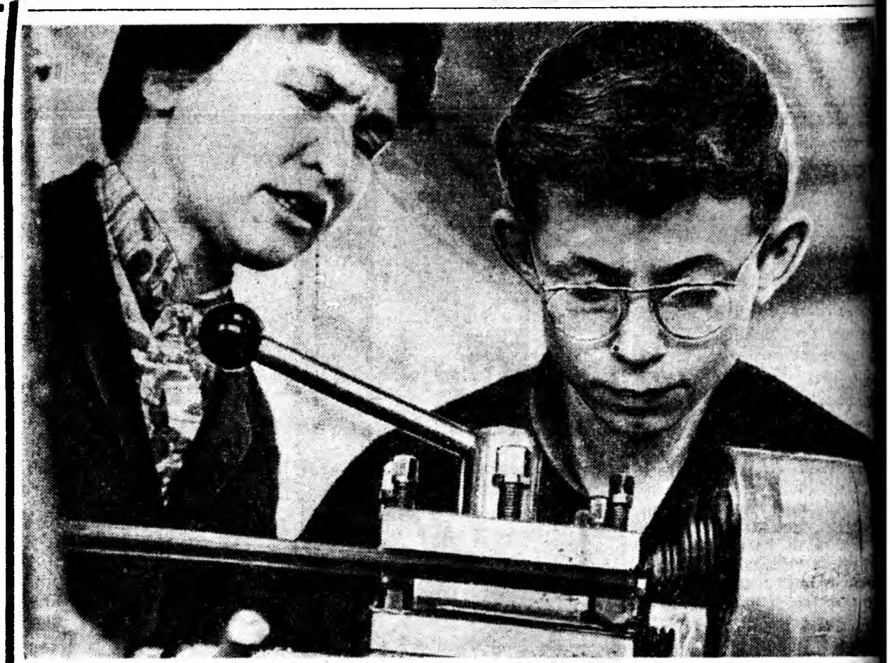
«СОВЕТ ЗАСАГАЙ 50 ЖЭЛЭЙ ОЙ» гэхэн фотококурсодо ерэнэн зурагууднаа. ТУРУУШЫНХЭЭ.