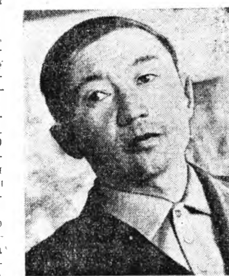
Ха хэрэгтэй болоо. Тинхэдэ нарай хурьгагай байра хүсэд бэлэн бо- лонхой.

МҮНӨӨ ҮЕНЬ үшөөл нилээд дулаахан, намдуу зохид на- марай сар байһанье наа, олбоно зүдэрүү, бүрүүлгэн хагсуу хүйтэ- нэй хаа орохонь холо бэшэ бо- лоо. Гантал нэгэ үлгөөгөөр боло- ходон, газаа үбэлгөөсө сайн ор- шонхой, үбэлэй шэмэрүүн хүйтэн үүдэ тоношожо байхалаа болохо ха юм. Тимэһээ үшөөл урин дулаан байна, сар эртэ гүлэ үбэлжэлгэдэ бэлдэжэ эхилдэггүй, нанга дээр буулаа малша мүнөө хомер лэ ёһо- той. Эгэл энэ үелэ, даб дээрэ ду- лаан байһанда, адууна малайнгаа үблэ тэжээл зөөжэ абаха, байра байдалаа найнар түхээрхэ, ду- лаалха, үбэлжэлгэдэ хараттай бү- хы нүмэ бэлдэхэ тон шухала бшүү. Тимэгүүй наамнай, үбэлэй хүйтэн гамнахагүүй. Энэниие хонишон, малшан, наилшан бүхэн хайн мэдэжэ, ойтожо ябана. Эдэ үдэрүүдтэ манай «Эрдэм» совхозой хонишондой бригаданууд- та, наалин гүүртэ, ферментуу- ташые ябаа наамтай, хаа хаанагүүй