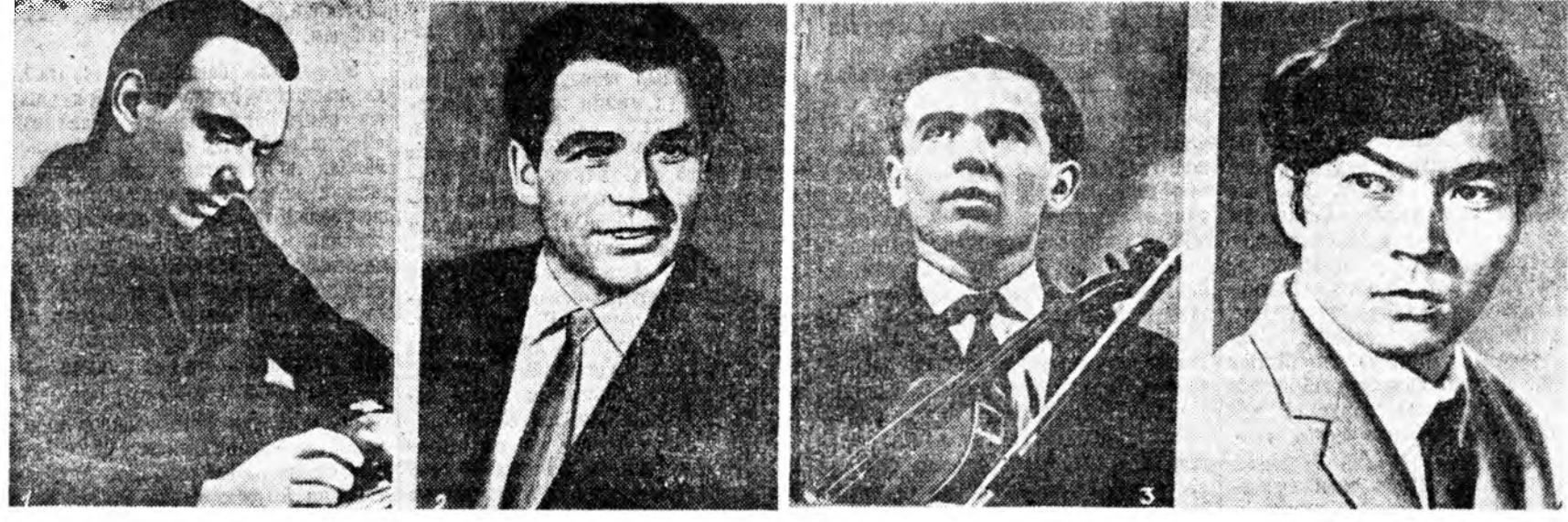
1. Киноактёр А. Баталов. 2. Дуушан Д. Гнатюк. 3. Скрипач В. Третьяков. 4. Поэт О. Сулейменов.