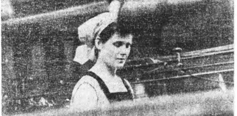
Удэришын шэнэ гуримай аша-и шадамараар, зүбөөр хэрэгсэл-эе фабрикин директин, партиин-организаци болон нитингэ бун-дэ эмхинүүд хүдэлмэришэдтөө ахлаха, амарха таатай зохи-длал олгоно. Тэндэ хүдэлмэ-риниин халаан усадхагдана-й. Хүдэлмэришэдэй эдэ хоол-иха сагуудта тогуудан прелати-нингэ стоголоо, буфедүүд ша-пирмаар хүдэлжэ болонхой. Хүдэлмэришэдэй неделидэ хоёр үдэр алдагуй амардаг, тэдэнэ-тай һайнаар үнгаргэлжэ бай-и тула нитээд эхэ эмхидхэлэй ажалри ябуулагдаана. Жэһээ-