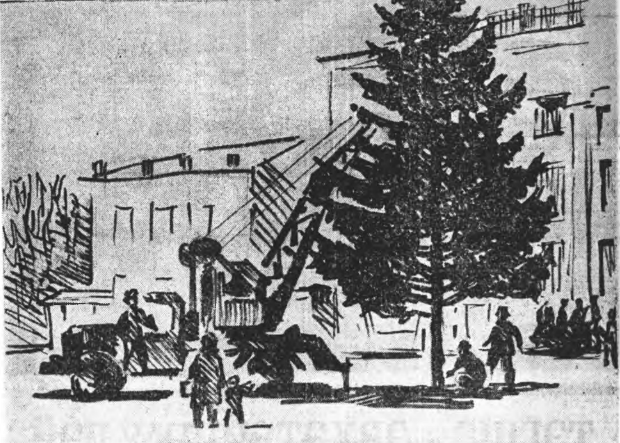
Шэнэ жэлэй ёлко бодхожо байна.