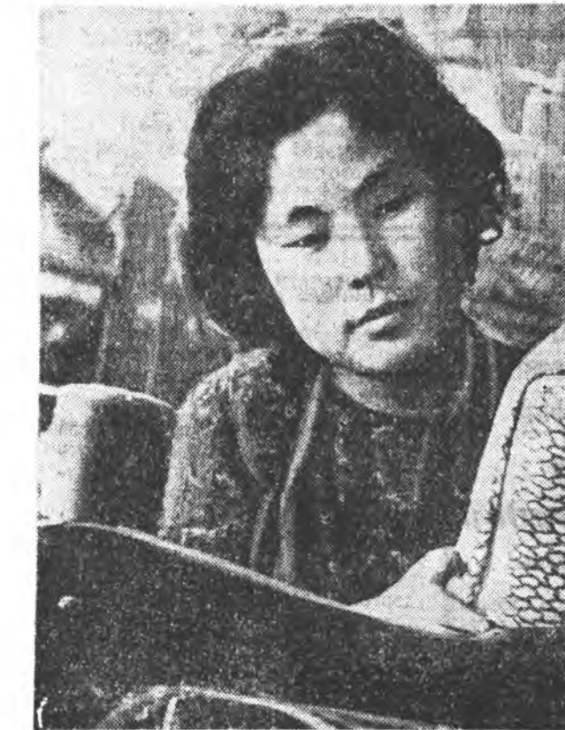
ШЭНЭ ЖЭЛ УГТУУЛАН