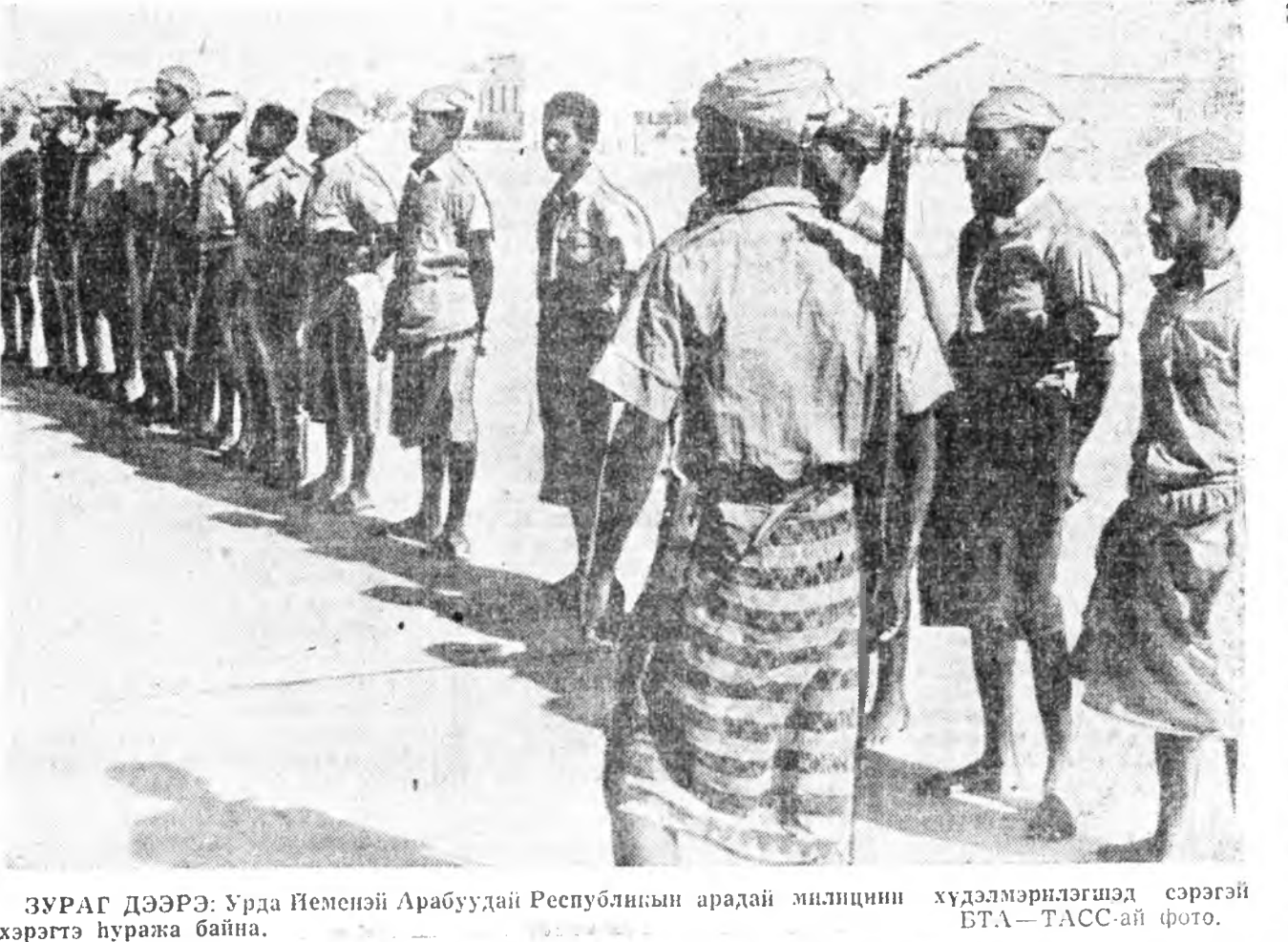
ЗУРАГ ДЭЭРЭ: Урда Йемендэй Арабуудай Республикын арадай милициин хүдэлмэрилгшэд сэрэгтэй хэрэгтэ һуража байна.

ТОКИО, (ТАСС). Вьетнамадэй дайнда ур дүнгүүдшын хэрэгшэдтэ сэрэгтэй шнжээлэгэнүүдэ хэһаа архаһын СНА-гай эрэмгөдэ урдалһан урла Япондо гунхарлагдаа. Иймэ урла толихо үүсхэл Француз математик Юван Шварц, Япон агробиолог Нити Фукушима, американ түүхшын Габриэль Борко гарган байна. Тэдэнэ Вьетнамад СНА-гай хэвнэ гэгтэ ябуулын мурда хэһаа үнэгэртөө жэлэй майда Стокгольмдо трибуналай хүдэлмэригдэ байха үедэ тэдэнэ тус урлаа толихо тухай үгэһэ өйлөгдөө һэн.