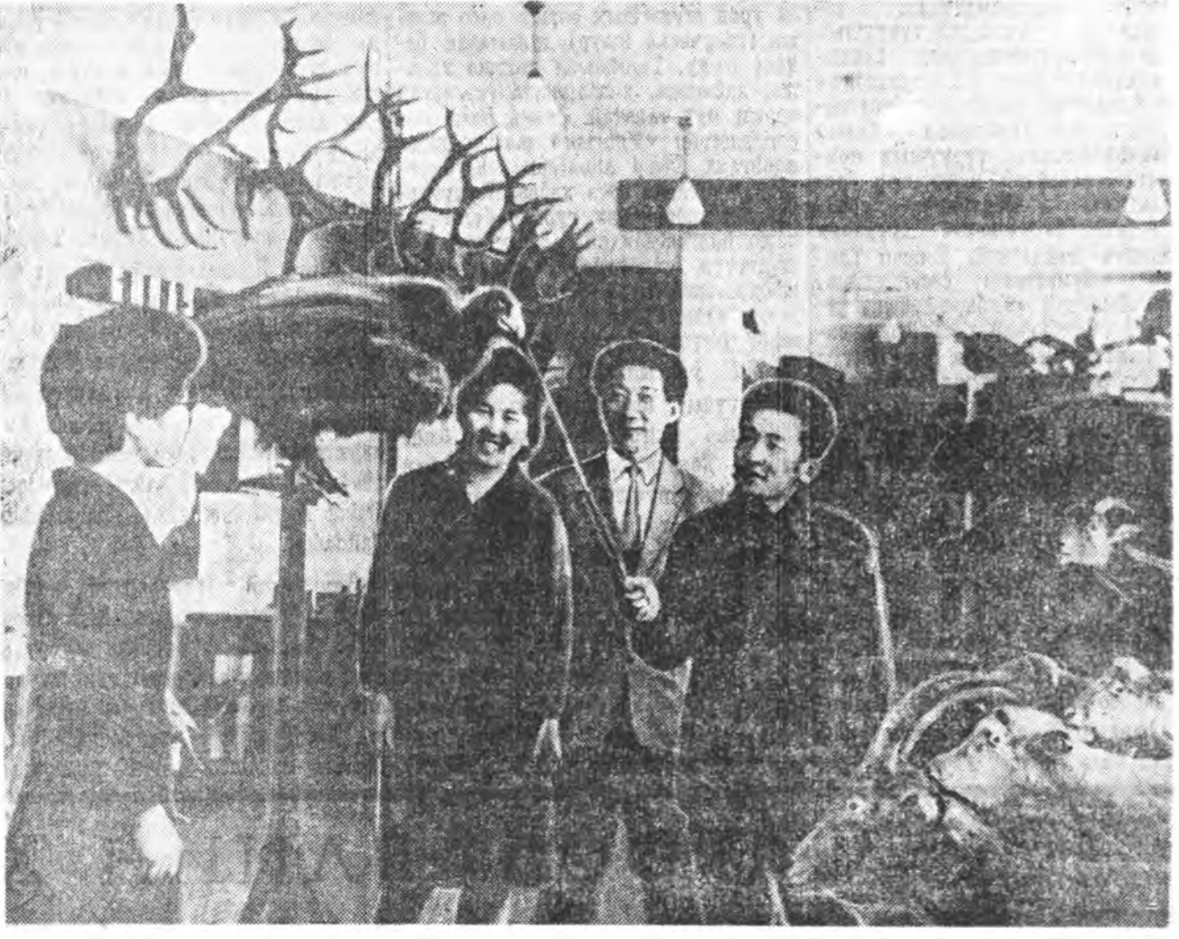
МОНГОЛОН АРАДАЙ РЕСПУБЛИКА. Гүрэнэй университетэй студентнэр зоологингоо музей соо...