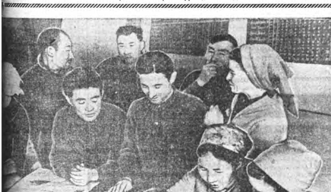
Эгэтын агайг сомон зүблэлэй мэдэлд хоёр тосхон ороосон: «Шобода» колхозой түб хуурин —Эгэтын агай, ой модо бэлдэх...