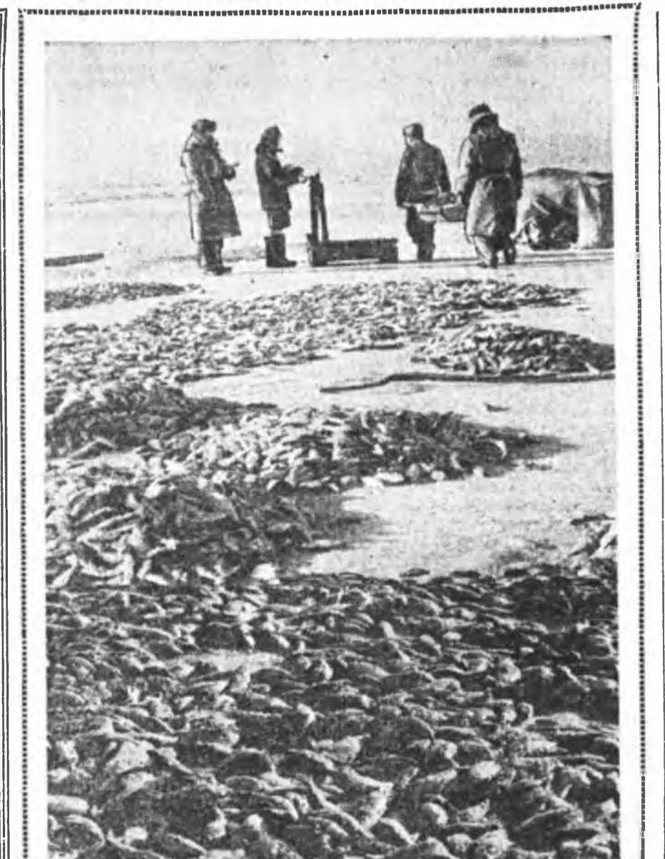
Байгалай мультээр хушагдахалаар Буряад АССР-эй Кабансын заганадай завод болон Байгал шадархи колхозуудай 18 бригада мультэн дорноо загана барика эхилээ. Зураг дээр: загана барилгаана бусан загана харуулагдана.

Ушар ном соо тус формонуудай залгалтануудыне тайлбарилдангүй, минн лэ сгемээр тэмдэгтэйгээл үнэргэгдэлгээр дээрнээ бага бэшээр үзэжэ хэлэнэ гэжэ ханагана. Урланэ эдэ формонууд амаарлан үзэгдэлгээл, мүн лэ саг бага гэхэ мэтэ шалтагаанаар хайгаданай байгаа бээ. Тээл худал соо эдэ формонуудай дэлгэрэнгүйгээр үгтөө хадань, хэсээлгээл бэшэ наань, хожомынэ уншхадань, сээжээлгээл хэрэгтэй ха юм. Глаголой формонуудыне табиыхагүй байхалаа, причастие, деепричастие олохо шаланагүй; причастие, деепричастинудыне табиыхагүй байхалаа, тээгээгээр гаргагданай ороолуудыне олохо, сэгэлэтэ табижа шаланагүй.