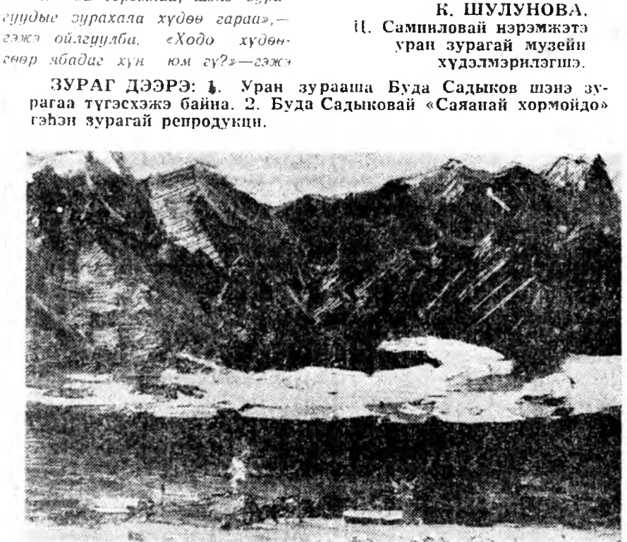
УРАГ ДЭЭРЭ: 1. Уран зурааша Буда Садиков шэнэ зурагаа түгээхэжэ байна. 2. Буда Садиковай «Саянап хормойдо» гэһэн зурагай репродукци.

Тала. Еһотойл тала, зэрлэгэн, добо. Сэнхир ариун тэнгэри. Энэ зураг харахадаа, сэдхэхэдэ ямар- шибэ лишама дүгэ, түрэл буряад