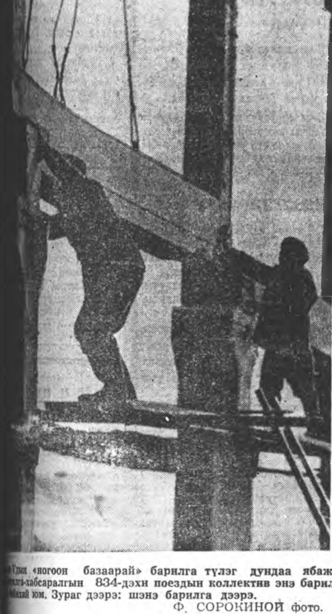
«Монгол базарай» барилга түлэг дундаа ябажа хамгааралгын 834-дохн поедын коллектив энэ барил-ганы юм. Зураг дээрэ: шэнэ барилга дээрэ.