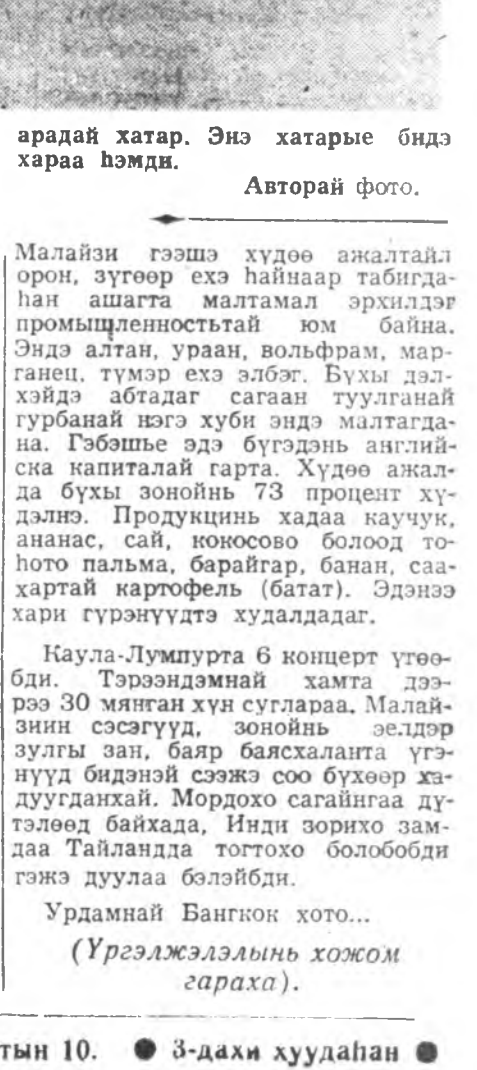
ЗУРАГ ДЭЭРЭ: Малайзин арадай хатар. Энэ хатарые бидэ далайн эрьдэ амаржа байхдаа харам хэмди.

Энэ ордон соо оройной засагай хамаг суглаа хураал болодог юм ха.