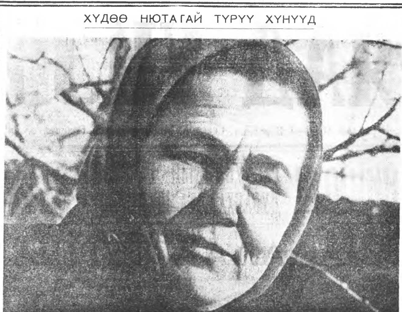
Мария Николаевнагай үгэлүүгүр үнэсээ...